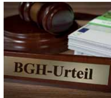
Starkes Urteil für Versicherte.

Bei einem Widerruf erhalten Sie – anders als bei der Kündigung – alle eingezahlten Beiträge ohne Abzug von Maklerprovisionen und Verwaltungskosten zurück. Und nicht nur das: Die Versicherung muss Sie auch an dem mit Ihrem Geld erzielten Anlagegewinn beteiligen. So können Sie bis zu 150 % der eingezahlten Beiträge zurückholen. Ein sattes Plus auf Ihrem Konto winkt!