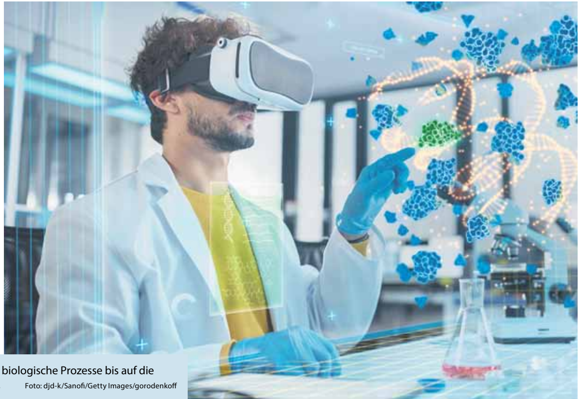
Mit Künstlicher Intelligenz lassen sich biologische Prozesse bis auf die Ebene der einzelnen Zelle simulieren.

(DJD-K). Die Rechenleistung von Computern steigt und steigt – heute ist sie bei jedem Smartphone millionenfach höher als beim Bordcomputer der Apollo-11-Rakete. Besonders die Bereiche Künstliche Intelligenz (KI) und das sogenannte Deep Learning machen riesige Fortschritte – und bringen auch die medizinische Forschung voran. Zum Beispiel wird KI bei der Erforschung des Immunsystems durch das Gesundheitsunternehmen Sanofi in Deutschland eingesetzt – mehr dazu im Podcast „Gesundheit & Innovation“. So lassen sich komplexe Prozesse bis auf die Ebene der einzelnen Immunzelle betrachten. Lernende Algorithmen können in anonymisierten Datensätzen Muster erkennen, um zum Beispiel die Medikamentenwirksamkeit zu ermitteln. Die richtigen Fragen muss dem Computer allerdings immer noch der Mensch stellen.