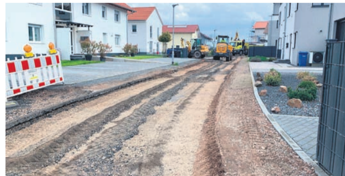
Der Straßen-Endausbau „Am Seerich“ hat begonnen, die vorläufigen Baustraßen weichen nun dem finalen Straßenbelag.

Münster (MA) In Münsters jüngstem Neubaugebiet „Am Seerich“ haben die Bauarbeiten zum Straßen-Endausbau begonnen. Aufgrund von Liefer Schwierigkeiten der Materialien hatte sich der Baubeginn zunächst leicht verzögert, doch mittlerweile rollen im Baugebiet die Bagger und Lastwagen. An einigen Stellen ist der vorläufige Straßenbelag bereits entfernt worden. Mit diesem letzten Arbeitsschritt erhält die Siedlung nun ihr endgültiges Erscheinungsbild. Im Bereich „Auf der Beune“ wird eine neue Asphaltdeckschicht aufgebracht, der Wohnsiedlungs-Bereich erhält eine Betonpflasterdecke mit weicher Separation (also ohne Bordsteinkanten). Zusätzlich müssen Anpassungsarbeiten und Reparaturen am vorhandenen Straßen-