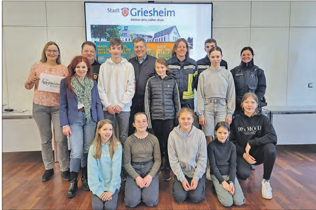
BEGRÜSSUNG der teilnehmenden Kinder im Rathaus.

15 Mädchen und neun Jungen zu Gast bei der Stadtverwaltung