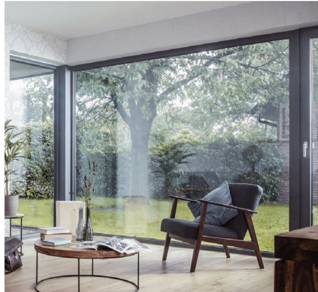
Anthrazitfarbene Fenster bieten einen ruhigen und aufgeräumten Rahmen für schöne Ausblicke.

kühl. Auch die warme und behagliche Holzoptik kann in PVC-Fenstern eingearbeitet werden. Neben der Optik sollten Bauherren auch die Themen Einbruchschutz, Schall- und Sichtschutz sowie integrierte Lüftungssysteme bedenken. Der Fachhändler vor Ort ist hier der richtige Ansprechpartner für eine Beratung.