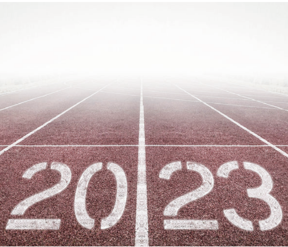
2023 bringt zahlreiche Veränderungen. Einige sind schon bekannt.

Darüber hinaus wird es eine dauerhafte Heizkosten- und Klimakomponente als Zuschlag auf die Höchstbeträge der Miete oder Belastung geben. Damit soll der Verwaltungsaufwand im Rahmen gehalten und Anreize zum Energiesparen erhalten bleiben. „Wissend, dass sich die