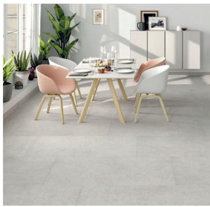
Durch die Wahl eines langlebigen, ökologisch verträglichen Materials wie der keramischen Fliese kann jeder Bauherr seinen CO 2 -Fußabdruck verbessern und zugleich Geld sparen.

(spp-o) Bauherren setzen heute auf Energie- und Kosteneffizienz und bevorzugen ökologisch verträgliche Materialien. Dadurch ändert sich der Blick auf Bodenbeläge, die nicht nur die Raumluftqualität des Eigenheims beeinflussen, sondern auch, wie groß dessen Reinigungs- und Renovierungsaufwand ist – und welche Unterhaltungskosten er verursacht. Durch die Wahl eines langlebigen, ökologisch verträglichen Materials wie der keramischen Fliese kann jeder Bauherr seinen CO 2 -Fußabdruck verbessern und zugleich Geld sparen. Besondere Vorteile bei Umwelt- und Klimaschutz bieten Fliesen aus heimischer Erzeugung, wie Jens Fellhauer vom Bundesverband Keramische Fliesen e. V. erläutert: „Neben kurzen Transportwegen der produktionsnah gewonnenen, unbedenklichen mineralischen Rohstoffe schonen eine hohe Energieeffizienz und strengste Umweltschutz-Maßnahmen in deutschen Werken Umwelt und Klima. Und im Vergleich zu Importfliesen, beispielsweise aus China oder Indien, sorgt der kurze Weg zum Kunden dafür, dass deutsche Fliesen besonders klimafreundlich sind.“ Als besonders effizienter Wärmeleiter ermöglicht Keramik auf der Fußbodenheizung weitere CO 2 -Einsparungen – zum Beispiel in Kombination mit Wärmepumpen oder Solar Kollektoren.