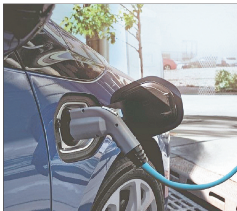
Mit der so genannten THG-Quote (Treibhausgasminderungs-Quote) können sich die Besitzer von Elektroautos über eine attraktive Prämie freuen.

Der Verkauf der THG-Rechte ist dabei ganz einfach. So bietet beispielsweise die EMS, eine Tochtergesellschaft des