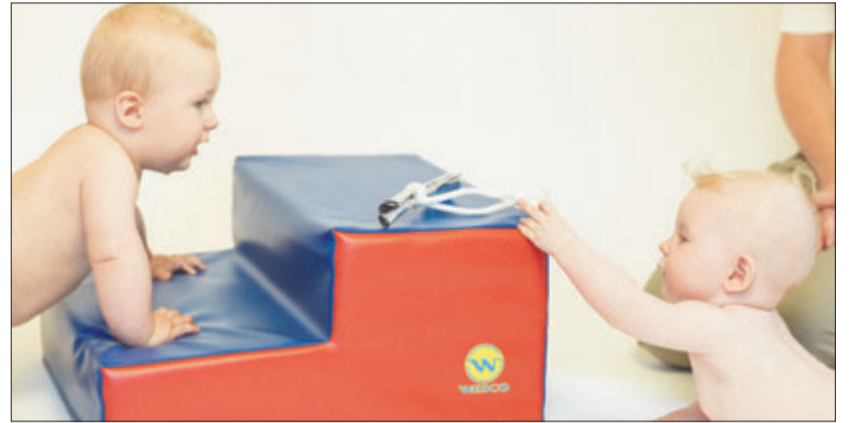
Im PEKiP-Kurs der Elternakademie am GZO fühlt „Baby“ sich bei 25 Grad pudelwohl.

Spiel- und Bewegungsanregungen für Babys