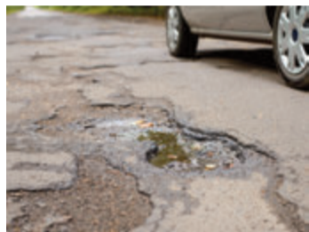
Typische Asphaltfrostschäden in der kalten Jahreszeit.

Unter bauamt@michelstadt.de werden Meldungen zu witterungsbedingten Frostschäden entgegengenommen. red