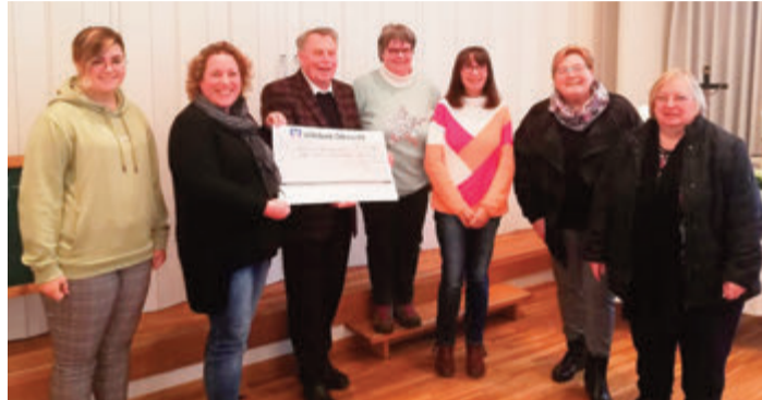
Der Kirchenvorstand der evangelischen Kirchengemeinde Kirchbrombach.