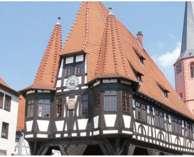
Herzstück der Innenstadt ist das historische Rathaus, um das herum jedes Jahr der Weihnachtsmarkt stattfindet.

Michelstadt. Die Stadt hat die Besucher nach ihrer Meinung befragt, und die Ergebnisse liegen vor. Unter dem Titel „Was moanscht'n du?“ konnten Gäste und Anwohner der Stadt in aufgestellten Befragungskabinen sagen, was ihnen gefällt und was sie stört. Dabei fand die Aktion deutlichen Anklang: insgesamt 256 Fragebögen wurden aussagekräftig ausgefüllt, eine Abschlussquote von knapp 80 Prozent. Die Antworten sollen der Stadt Anhaltspunkte für Verbesserungsmöglichkeiten geben. Der Grund für einen Besuch in der Innenstadt war – vermutlich datumsbedingt – hauptsächlich der Weihnachtsmarkt: 61,5 Prozent kamen beim letzten Besuch deswegen in den Stadtkern. Darauf folgten gezielte Einkäufe und Besuche in der örtlichen Gastronomie und schlichtes Bummeln (48,38,5 und 31,6 Prozent). Auffällig ist auch, dass die Mehrzahl der Besucher entweder vor Ort leben oder arbeiten oder fast jede zweite Woche die Innenstadt besuchen (zusammen fast 72 Prozent). Der Aufenthalt ist dann ausgedehnt: Deutlich mehr als die Hälfte bleibt länger als eine Stunde, ein Drittel immerhin mindestens eine halbe Stunde. Besonderen Anklang in der Innenstadt