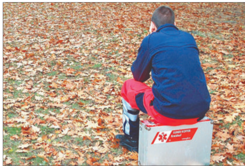
Nach belastenden Einsätzen brauchen auch Helfer oft Hilfe.

Odenwaldkreis. Lebensinschnitte wie Tod, schwere Unfälle oder auch Naturkatastrophen, wie im vergangenen Jahr die Flut im Ahrtal, verursachen nicht selten seelische Wunden, die nur schwer heilen. Deshalb hatte kürzlich das Team der „Notfallseelsorge und Krisenintervention im Odenwaldkreis“ zu einer Fortbildungsveranstaltung in den Versammlungsraum der katholischen Kirche nach Michelstadt eingeladen, um am Beispiel der Folgen für die Menschen der Flut an der Ahr die Aufgaben der Psychosozialen Notfallnachsorge (PSNV) den Gästen diese „psychische Erste Hilfe“ transparent zu machen.