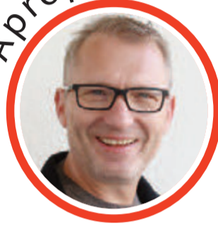
von Volker Zaborowski, Chefredakteur