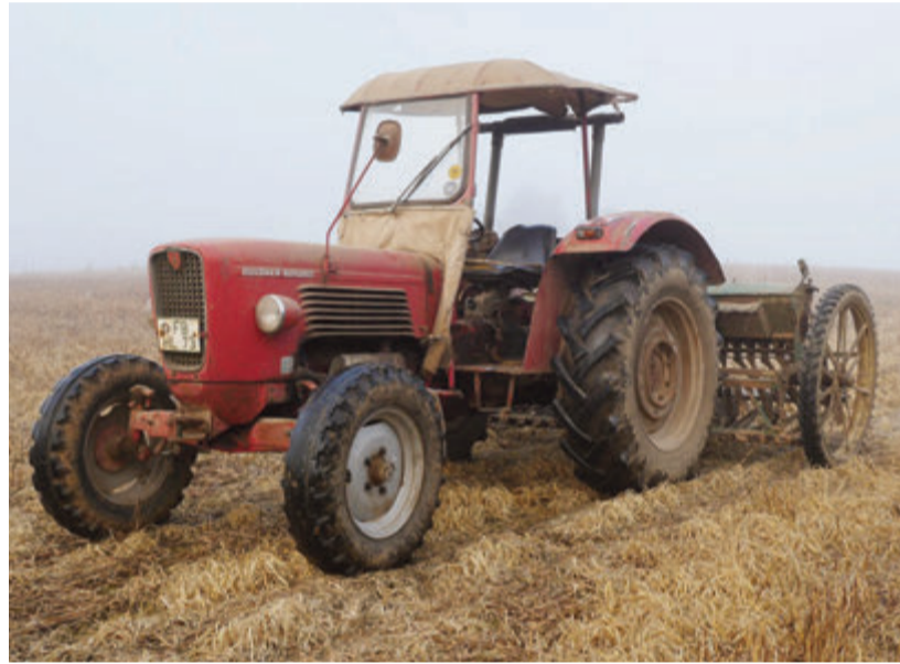
Ein alter Traktor, der seinen Dienst auf dem Feld leistet.