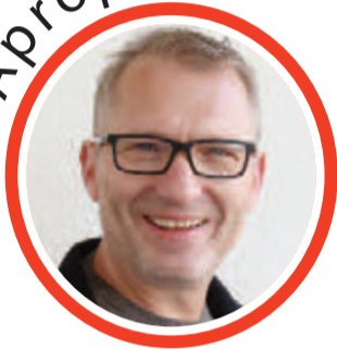
von Volker Zaborowski, Chefredakteur