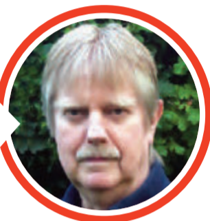
von Dr. Detlef Eichberg