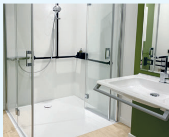
Ebenerdige Duschen mit faltbaren Türen sorgen für barrierefreien Umgang im modernen Pflegebad.

(akz-o). In Deutschland sind etwa 4,1 Millionen Menschen pflegebedürftig. Die Zahlen des Statistischen Bundesamts belegen auch: Etwa 80 Prozent dieser Menschen, werden zu Hause versorgt. Dort rückt dann ein Rückzugsort besonders in den Fokus: das eigene Bad. In Deutschlands Wohnungen sind millionenfach Bäder zu klein, um etwa einer benötigten Pflegekraft oder häuslichen Assistenz ausreichend Platz zu bieten, wenn die eigene alleinige Körperhygiene aufgrund motorischer Einschränkungen nicht mehr möglich ist. Auch für diese kleinen Grundrisse planen Experten pflegegerechte Lösungen. Im Schulterschluss und unter Federführung des ZVSHK, des Zentralverbands Sanitär Heizung Klima, wurden entsprechende Standards entwickelt, die es Fachhandwerkern, Architekten und Wohnberatern künftig erleichtern, pflegegerechte Bäder bei kleinen Grundrissen zu realisieren. Zu den Ausstattungsoptionen, die das Leben