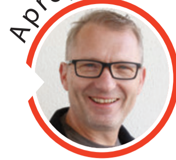
von Volker Zaborowski, Chefredakteur