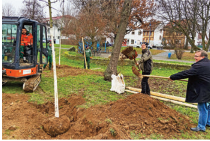
Pflanzung der ersten acht Bäume

Dieser erste kleine Miniwald ist der Beginn von weiteren „Tiny Forests“, für die derzeit noch Flächen, am besten verstreut über das Ortsgebiet von Groß- und Klein-Zimmern, gesucht werden. Ziel der Gesamtmaßnahme ist es das Mikroklima zu verbessern und weitere Beiträge zum Klimaschutz zu leisten. red