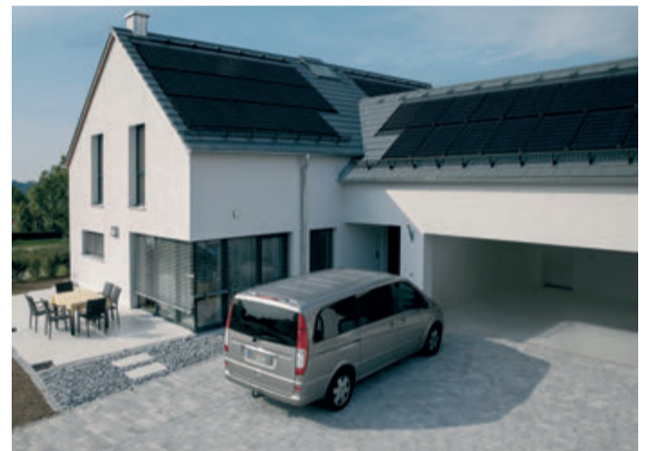
Neben einer funktionierenden Stromerzeugung soll sich eine PV-Anlage auch harmonisch ins architektonische Gesamtkonzept einfügen.

Alle Infos zu neuen steuerlichen Regelungen sind auf der Website des Finanzministeriums abrufbar: www.bundesfinanzministerium.de