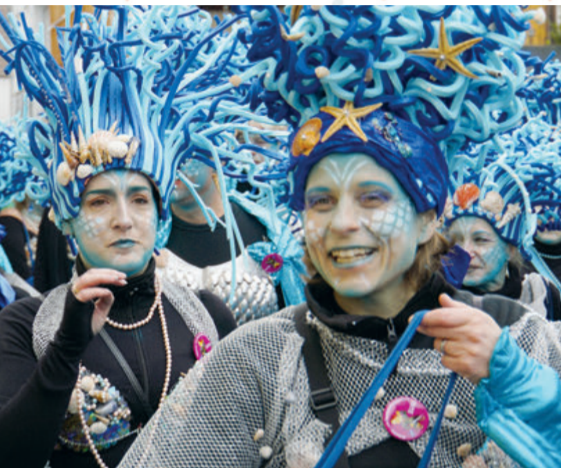
Aufwändige und ausgefeilte Kostüme gehören – wie hier in Ueberau – einfach dazu

Odenwaldkreis. Wohl nirgendwo dürfte man in der nächsten Zeit darum herumkommen: Die Hochphase der närrischen Zeit ist angebrochen. Montag und Dienstag geht es richtig rund mit Prunksitzungen, Umzügen und allgemeinen Feierlichkeiten. Nach den Jahren der Zurückhaltung brennen die Karnevalsvereine darauf, ihr Können, ihre Kreativität und ihre Feierlaune unter Beweis zu stellen. Da die Zahl der Veranstaltungen im Odenwaldkreis kaum zu überschauen ist, machen wir vom Odenwälder Journal keine Übersicht aller Veranstaltungen (Mehr gibt es bei uns online), sondern schauen auf die Hintergründe der Tradition. Feierlichkeiten, bei denen es zu einer satirischen Verkehrung gesellschaftlicher Verhältnisse kommt, gibt es bereits seit Jahrtausenden. Entsprechende Inschriften lassen sich im alten Babylon nachweisen, bei denen während der Feier Sklave und Herr gleichgestellt war. Auf europäischem Boden kam es zu einer sehr fruchtbaren Vermischung von heidnischem Geisterglauben mit christlicher Symbolik und den Spannungen in der sehr hierarchischen, engen Gesellschaftsstruktur. Vermutlich zum Auffangen entsprechender Tendenzen – sowohl des alten Aberglaubens wie auch der Tendenz zur Aufmüpfigkeit – gab die Kirche ihren Segen zum Spektakel. Den Kontrast zu den zwei ausgelassenen Tagen bildet dann der Aschermitt-