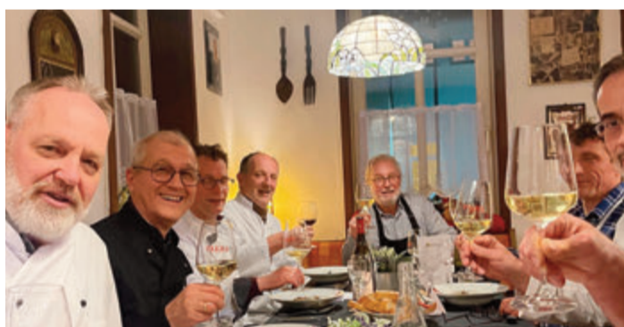
Ein Teil der Gründungsmitglieder erfreuen sich eines gelungenen Club-Starts.

Alsbach. Zum gemeinsamen Kochen auf hohem Niveau trifft sich einmal im Monat eine Männerrunde. Ziel ist ein mindestens viergängiges Menü mit begleitenden Weinen. Der Anspruch: Kochen auf hohem Niveau, frische jahreszeitliche Produkte möglichst aus der Region, kein Einsatz von Convenience, gepflegte Tischsitten bis hin zu kreativ gestalteter Tischdekoration. Für ihr anspruchsvolles Hobby konnte ein ideales Domizil gefunden werden: das Gasthaus „Zur Sonne“ in Alsbach, Hauptstraße 18, mit Profiküche und behaglichen Gasträumen für das gemeinsame Essen der zuvor zubereiteten internationalen Spezialitäten. Von dienstags bis sonntags wird deutsche und ungarische Küche angeboten, montags werden die Hobbyköche einmal im Monat aktiv.