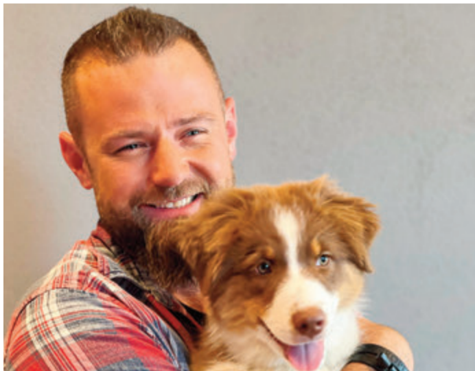
André Vogt mit einem glücklichen Hund auf dem Arm.

Erbach. Der aus der Fernsehsendung "Der Welpentrainer" bekannte André Vogt beschreibt in einem Vortrag am Mittwoch, 22. März, klare Linien im Umgang mit dem eigenen Hund. Ab 19 Uhr (Einlass 18.30 Uhr) geht es im Autohaus Böhm in der Werner-von-Siemens-Straße 104 um den richtigen Umgang und die passende Einstellung.