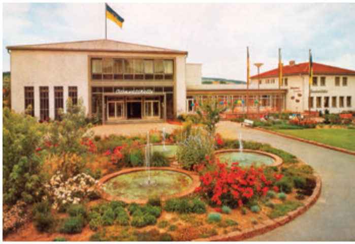
Die Odenwaldhalle etwa 1962.