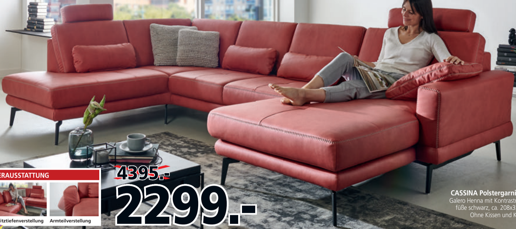
CASSINA Polstergarnitur in Stoff Galero Henna mit Kontrastnaht, Metallfüße schwarz, ca. 208x327x180 cm. Ohne Kissen und Kopfstützen.

GROSSE FARBAUSWAHL ZUM INDIVIDUELLEN PREIS