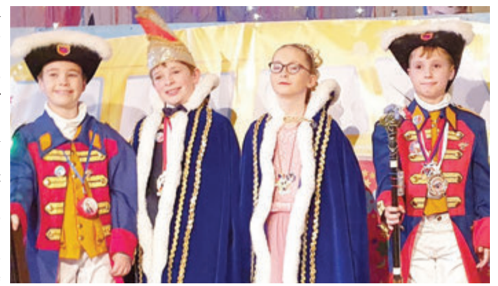
Die kleinen Fastnächter strahlten bei der Kindersitzung.

Erbach. Die Markt- und Bierhallen in Erbach konnten die Türen für die kleinsten Fastnächter im Odenwald öffnen. Der CV Ulk Erbach lud am Sonntag, 5. Februar, zur Kindersitzung. Viele kleine Fastnächter hatten ihren Spaß auf der Bühne und präsentierten lang einstudierte Garde- und Showtänze. Etwa 120 Kinder und Jugendliche im Alter zwischen drei bis 17 Jahren standen auf der Bühne. Der nächste Termin des CV Ulk ist am Rosenmontag, 20. Februar, Karten sind noch erhältlich. Der Vorverkauf erfolgt in der Touristik-Information am Erbacher Marktplatz. red