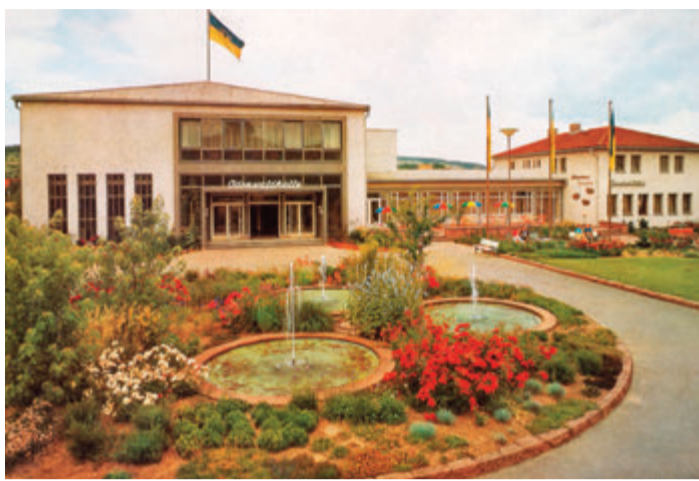
Die Odenwaldhalle etwa 1962.