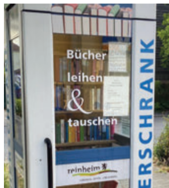
Auch dieser Bücherschrank wartet auf einen Paten, der sich um ihn kümmert und „in Schuss“ hält.