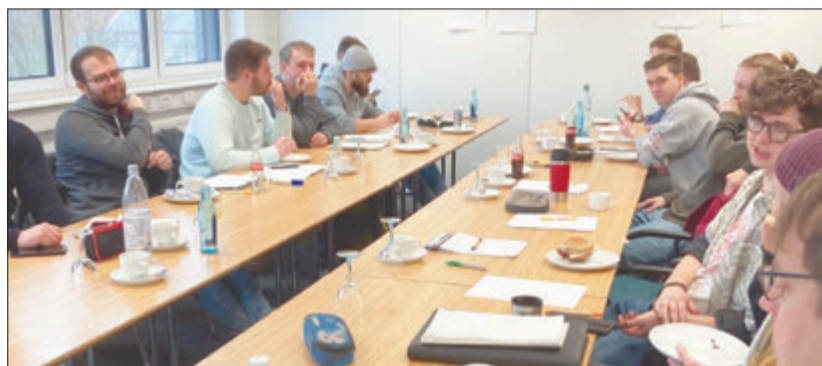
Für die Schüler stellt der Workshop die ideale Ergänzung zum Lehrplan dar.

Erbach. 15 Studierende der Fachschule für Holztechnik des Beruflichen Schulzentrums Odenwaldkreis (BSO) nahmen am 30.01. an einem Existenzgründungs-Workshop teil, den der Wirtschafts-Service der OREG speziell für diese Personengruppe im Rahmen der Gründungs-offensive Bergstraße-Odenwald, die von der EU und dem Land Hessen finanziell gefördert wird, entwickelt hat.