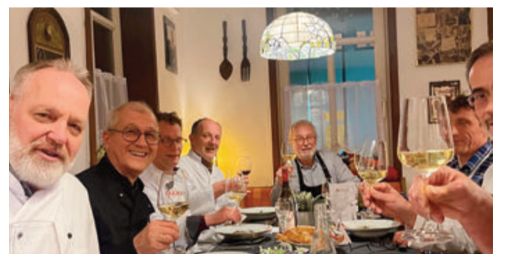
Ein Teil der Gründungsmitglieder erfreuen sich eines gelungenen Club-Starts.

Alsbach. Zum gemeinsamen Kochen auf hohem Niveau trifft sich einmal im Monat eine Männerrunde. Ziel ist ein mindestens viergängiges Menü mit begleitenden Weinen. Der Anspruch: Kochen auf hohem Niveau, frische jahreszeitliche Produkte möglichst aus der Region, kein Einsatz von Convenience, gepflegte Tischsitten bis hin zu kreativ gestalteter Tischdekoration. Für ihr anspruchsvolles Hobby konnte ein ideales Domizil gefunden werden: das Gasthaus „Zur Sonne“ in Alsbach, Hauptstraße 18, mit Profiküche und behaglichen Gasträumen für das gemeinsame Essen der zuvor zubereiteten internationalen Spezialitäten. Von dienstags bis sonntags wird deutsche und ungarische Küche angeboten, montags werden die Hobbyköche einmal im Monat aktiv.