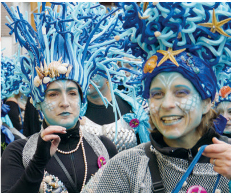
Aufwändige und ausgefeilte Kostüme gehören – wie hier in Ueberau – einfach dazu

Landkreis Darmstadt-Dieburg Wohl nirgendwo dürfte man in der nächsten Zeit darum herumkommen: Die Hochphase der närrischen Zeit ist angebrochen. Montag und Dienstag geht es richtig rund mit Prunksitzungen, Umzügen und allgemeinen Feierlichkeiten. Nach den Jahren der Zurückhaltung brennen die Karnevalsvereine darauf, ihr Können, ihre Kreativität und ihre Feierlaune unter Beweis zu stellen. Da die Zahl der Veranstaltungen im Odenwaldkreis kaum zu überschauen ist, machen wir vom Odenwälder Journal keine Übersicht aller Veranstaltungen (Mehr gibt es bei uns online), sondern schauen auf die Hintergründe der Tradition. Feierlichkeiten, bei denen es zu einer satirischen Verkehrung gesellschaftlicher Verhältnisse kommt, gibt es bereits seit Jahrtausenden. Entsprechende Inschriften lassen sich im alten Babylon nachweisen, bei denen während der Feier Sklave und Herr gleichgestellt war. Auf europäischem Boden kam es zu einer sehr fruchtbaren Vermischung von heidnischem Geisterglauben mit christlicher Symbolik und den Spannungen in der sehr hierarchischen, engen Gesellschaftsstruktur. Vermutlich zum Auffangen entsprechender Tendenzen – sowohl des alten Aberglaubens wie auch der Tendenz zur Aufmüpfigkeit – gab die Kirche ihren Segen zum Spektakel. Den Kontrast zu den zwei ausgelassenen Tagen bildet dann der Aschermitt-