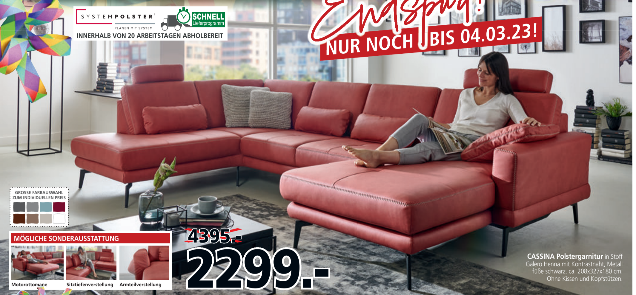
CASSINA Polstergarnitur in Stoff Galero Henna mit Kontrastnaht, Metallfüße schwarz, ca. 208x327x180 cm. Ohne Kissen und Kopfstützen.

GROSSE FARBAUSWAHL ZUM INDIVIDUELLEN PREIS