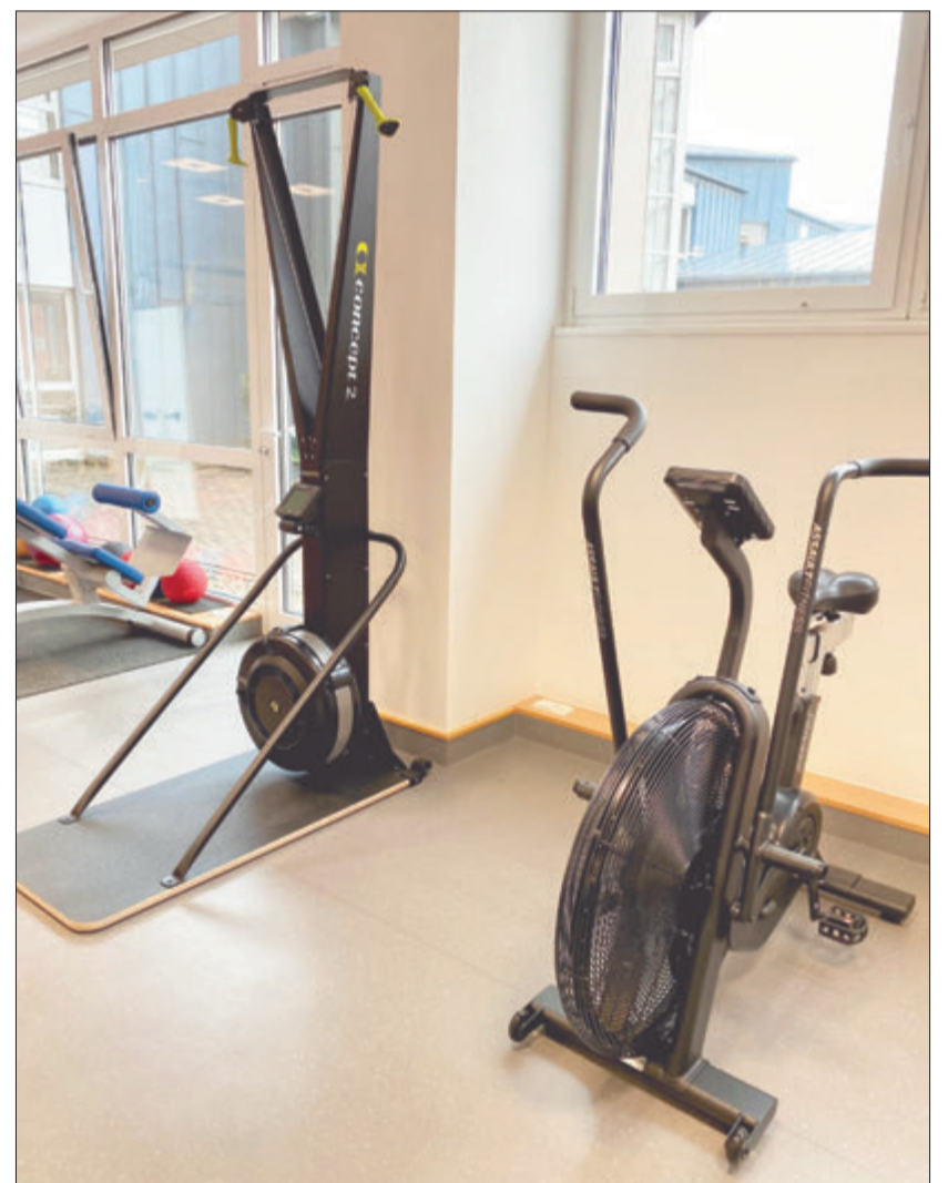
Ski-Ergometer und Air Bike Pro sind die beiden Neuzugänge im Cardio-Bereich des PhysioZentrums. Die High-Performance Geräte trainieren Kraft-Ausdauer und bringen gleichzeitig das Herz-Kreislauf-System in Schwung.

Neue innovative Cardio-Geräte im PhysioZentrum