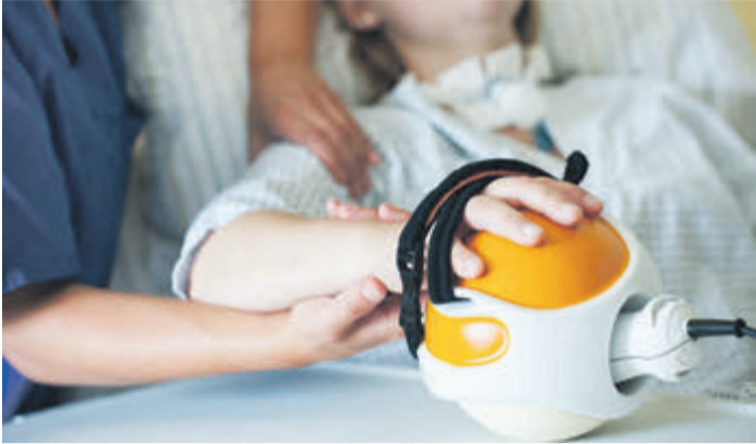
Eine ergotherapeutische Behandlung hilft auf dem Weg zurück in ein selbstbestimmtes Leben.

Ergotherapeuten helfen Patienten in Schlossberg-Klinik