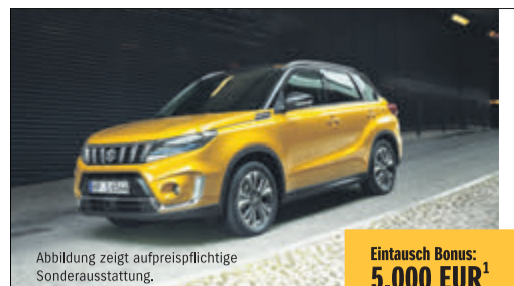
Abbildung zeigt aufreispflichtige Sonderausstattung.