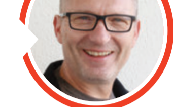
von Volker Zaborowski, Chefredakteur