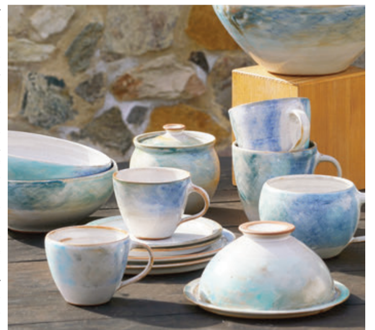
Geschirr in Blautürkis mit Glasur.

Im Landkreis Darmstadt-Dieburg nimmt zum Beispiel das Atelier Bartel in der Weinbergstraße 4 in Darmstadt, der Raku-Keramikwerkstatt Lindenhof, Außerhalb