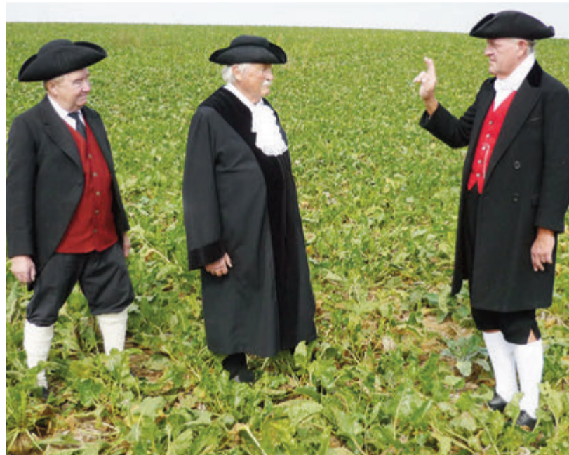
Die Hohen Herren des Dorfes diskutieren auf dem Acker über den Fortgang der Geschichte.

Zu den Sagen gehören auch bäuerliche Feuer- und Viehbräuche. Diese Bräuche basieren meist auf uralten Erfahrungswerten, die, mythologisch aufbereitet, an die nachfolgenden Generationen ge-