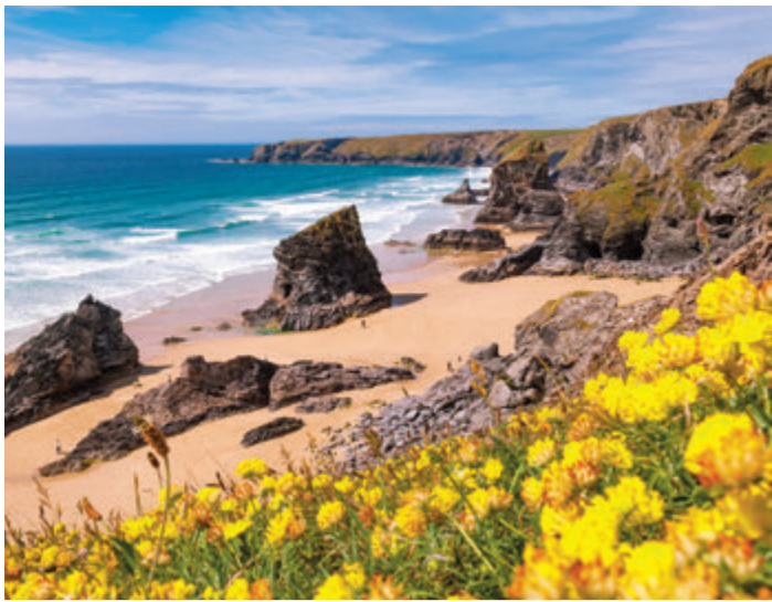
Die Küste Cornwalls sieht schön und wild aus. Hier: Bedruthan Steps Cornwall.