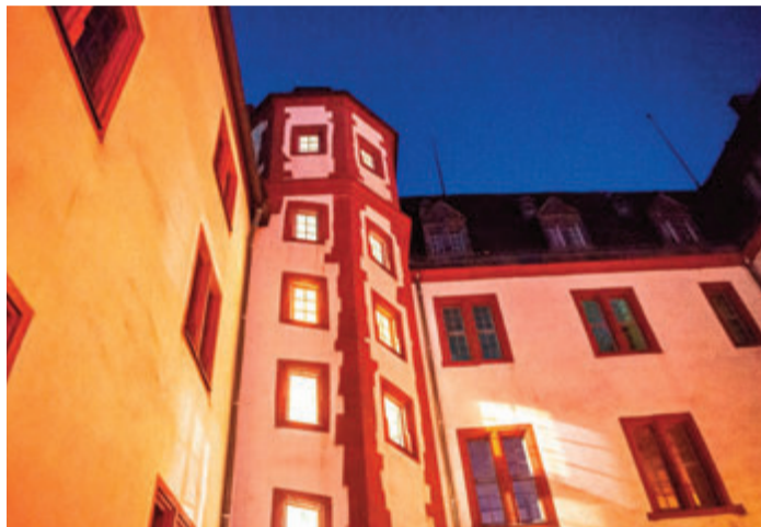
Ein Detail, das in der Nacht besonders schön wirkt.