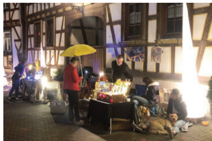
Nach dem großen Erfolg im letzten Jahr nehmen die Veranstalter das Konzept wieder auf.

Weitere Infos sowie das Anmeldeformular zum Markt auf der Homepage www.gewerbeverein-reichelsheim.de . red