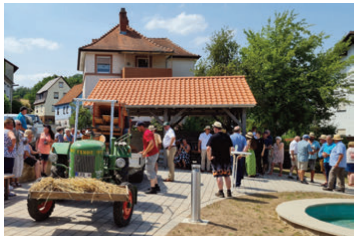
Gutes Beispiel: In Michelstadt-Steinbach wurde Mitte Juni 2022 ein Mehrgenerationenplatz eröffnet, der früher als Dreschplatz gedient hatte. In die Gestaltung des Platzes flossen rund 150.000 Euro an Fördermitteln aus dem Dorfentwicklungsprogramm. Insgesamt wurden dort 235.000 Euro investiert.