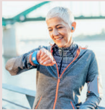
Tragbare Prävention

(spp-o) Für eine umfassende Prävention von Herz-Kreislauf-Er-