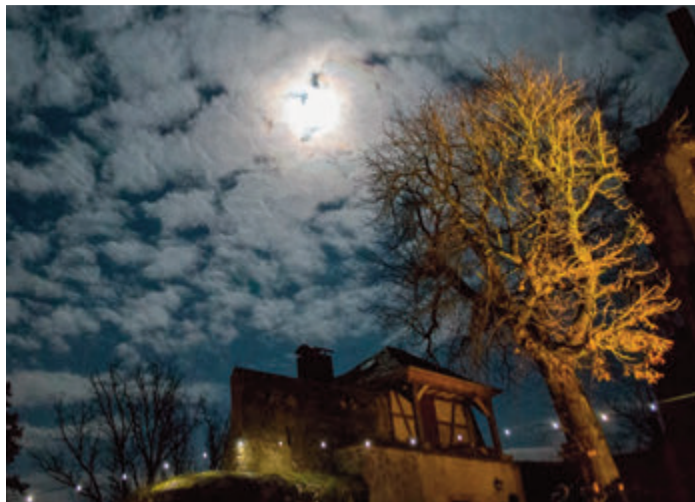
Auch ein Baum kann im künstlichen Licht geheimnisvoll wirken.

Interessierte werden von den Veranstaltern gebeten, Taschenlampen mitzubringen. Der Treffpunkt ist am Parkplatz vor dem Lichtenberger Institut. Der Eintritt ist kostenlos. Anmeldung und Infos unter: 06166-9336972 oder k o n t a k t @ g e o p a r k - f i s c h b a c h t a l . o r g . r e d