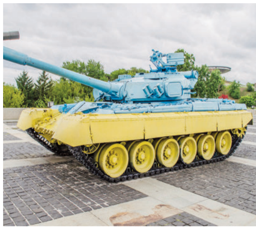
Wegen des russischen Angriffskrieges sind Millionen Ukrainer auf der Flucht. Viele kamen auch in den Landkreis Darmstadt-Dieburg.