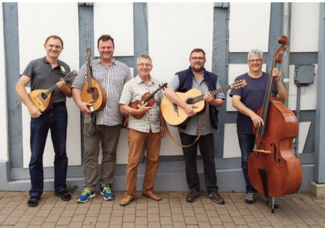
Die fünf Musiker, die sich mit der Revolution beschäftigen.