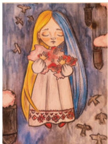
Eines der Bilder, mit denen die Ukrainer im Exil ihre Wünsche ausdrücken Brombachtal. Eine Ausstellung mit Fotos und Texten zum Thema

Flucht aus der Ukraine startet am Sonntag, 19. März, von 14 bis 18 Uhr im Dorfgemeinschaftshaus Kirchbrombach. Unter dem Titel „nEU starten“ geht es um ukrainische Lebensberichte, Wünsche und Träume von Ukrainern und Ukrainerinnen, die in Süddeutschland untergekommen sind. Organisiert wird die Ausstellung vom Verein Save Ukraine.