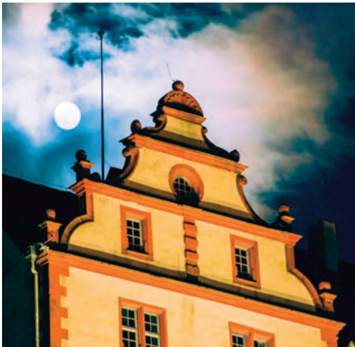
Der Vollmond geht über dem Renaissance-Schloß auf.

Fischbachtal. Bei Anbruch der Nacht findet am Samstag, 18. März, um circa 19 Uhr eine Taschenlampen-Führung der Geopark-vor-Ort-Begleiter Fischbachtal um und im Schloss Lichtenberg statt.