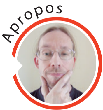
von Sven Iwertowski, Redaktionsleiter