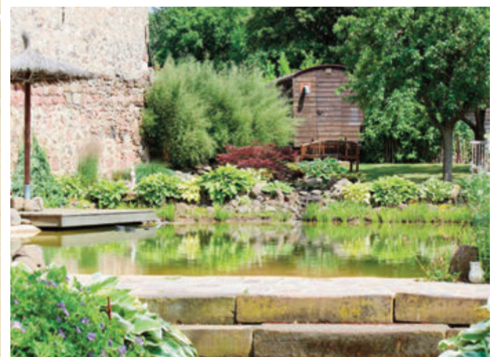
20 Jahre Offene Gartenpforte Hessen: Garten jetzt anmelden!