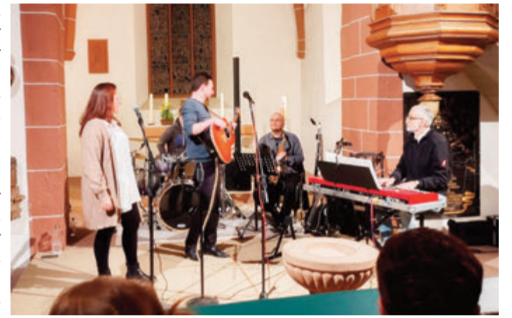
„Granny’s Pie“ ist voll im Spiel.