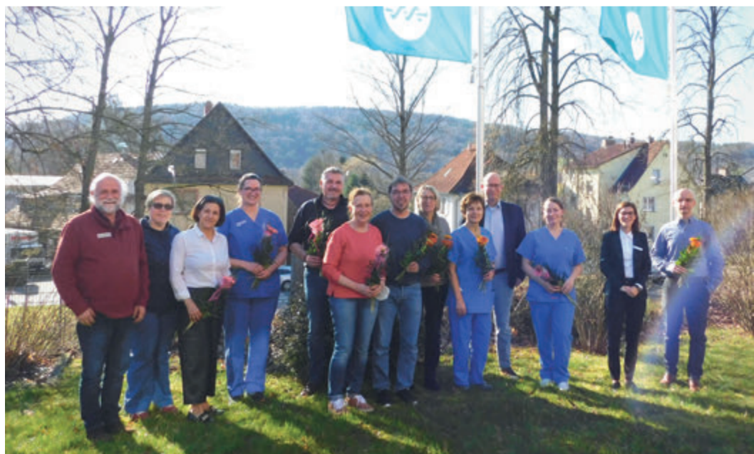
Wertschätzung in gemütlicher Runde an der Asklepios Schlossberg Klinik in Bad König: Die Jubilare des vergangenen halben Jahres wurden im Rahmen des Jubiläums-Kaffees geehrt.

stressigen Alltag. Außerdem zeige es, dass alle an einem Strang ziehen und zu einem Team gehören. „Hier ist keiner wichtiger als der andere. Jeder einzelne hat seinen Aufgabenbereich und ist ein wichtiger Baustein im Klinikalltag.“ Insgesamt neun Mitarbeiter wurden beim Jubiläumskaffee geehrt, die seit mindestens zehn Jahren bereits zum Kollegium gehören. „Es ist heutzutage nicht mehr die Regel, dass Mitarbeitende über viele Jahre oder sogar über mehrere Jahrzehnte hinweg beim selben Arbeitgeber bleiben. Wir wissen das wirklich zu schätzen und sind stolz darauf. Wir sehen es als Bestätigung dafür, dass die Schlossberg Klinik ein Arbeitsplatz mit Zukunftsaussicht ist, an dem sich die Mitarbeitenden wohlfühlen. Und daran werden wir immer weiter arbeiten“, verspricht die Geschäftsführerin.