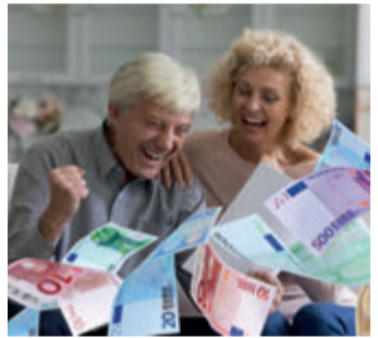
Es geht um viel Geld.

Bei einem Widerruf erhalten Sie – anders als bei der Kündigung – alle eingezahlten Beiträge ohne Abzug von Maklerprovisionen und Verwaltungskosten zurück. Und nicht nur das: Die Versicherung muss Sie auch an dem mit Ihrem Geld erzielten Anlagegewinn beteiligen. So können Sie bis zu 150 % der eingezahlten Beiträge zurückholen. Ein sattes Plus auf Ihrem Konto winkt!