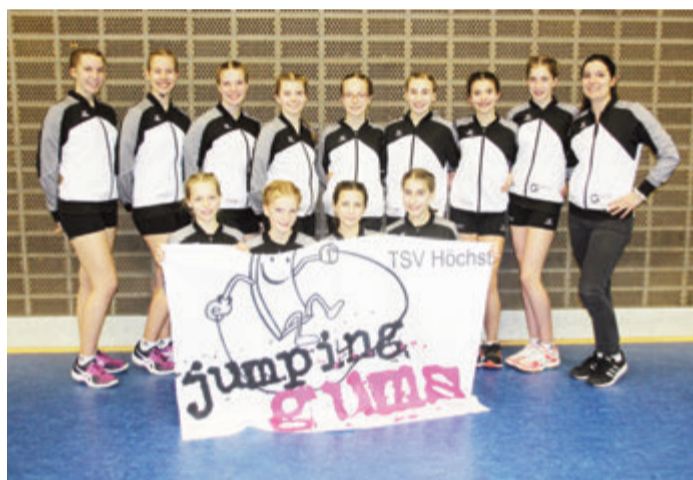
Die Mannschaft der „Jumping Gums“ freut sich über ihren Erfolg.

dem dritten Platz vorliebnehmen musste. Dennoch war am Ende in der Gesamtabrechnung aller acht Disziplinen die Goldmedaille und das Startrecht bei den Deutschen Titelkämpfen die Belohnung.