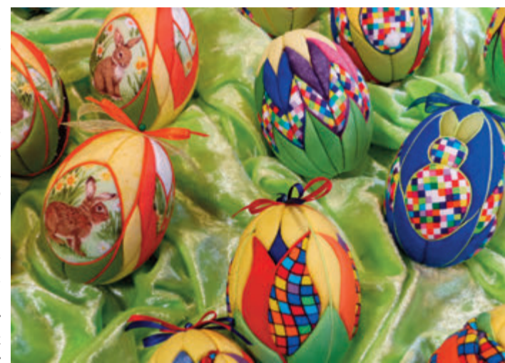
Handwerkskunst rund ums Ei

frisch geschlüpfte Küken zu sehen geben. Der Markt ist am Samstag, 25. März, von 12 – 18 Uhr und Sonntag, 26. März, von 10 – 17 Uhr geöffnet. Im Eintritt von drei Euro (Kinder bis zwölf Jahre kostenlos) ist auch der Zugang zum Lindenfels Museum und in das Deutsche Drachennmuseum inkludiert. Am Vorabend, 24. März, wird es um 21.30 Uhr ein Geburtstagsfeuerwerk zum 900-jährigen Stadtjubiläum von Lindenfels geben.