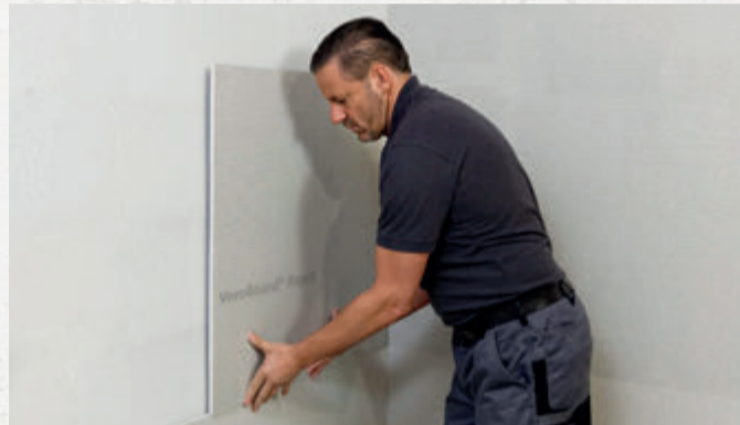
Auch für Heimwerker machbar: die Verkleidung einer Innenwand mit VeroBoard Rapid.

Vorsicht ist bei dauerhaft durchfeuchteten Wänden geboten. Mögliche Ursachen gibt es viele. Im Zweifel ist es besser, einen Fachbetrieb hinzuzuziehen. Erst wenn die Wand komplett trocken und der Schimmelbefall eindeutig als oberflächlich identifiziert ist, ist die Innenwandsanierung mit VeroBoard Rapid zu empfehlen.