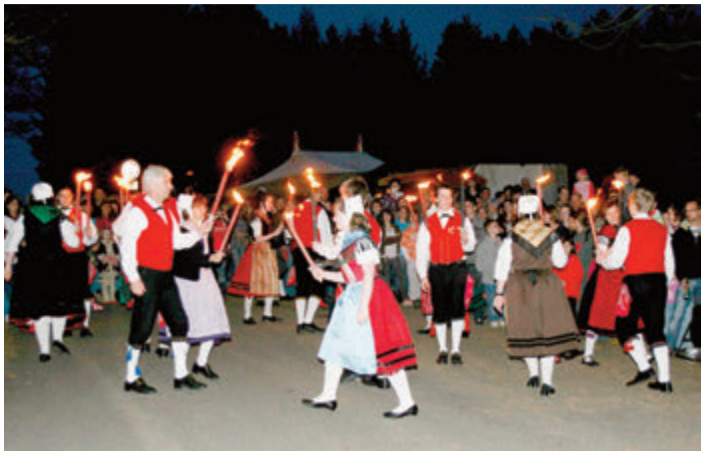
Trachtengruppe Reichelsheim beim Fackeltanz.

Reichelsheim. Zu Lärmfeuern am Samstag, 25. März hat die Gemeinde ein Programm zusammen-