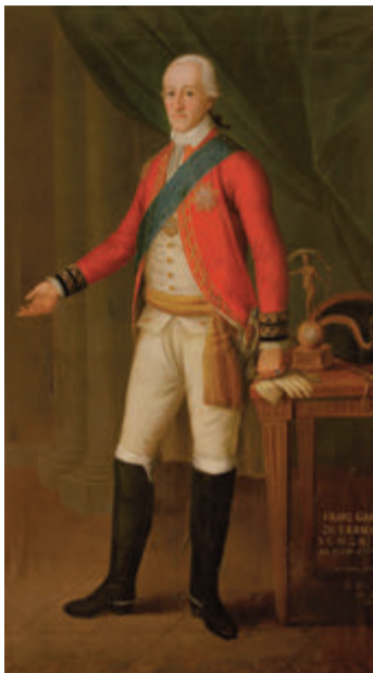
Porträt des jungen Graf Franz I., Öl auf Leinwand, Schloss Erbach.

Ab der Saisonöffnung beginnt wird ein besonderes Jahr: Seit Jahresbeginn liegt der Betrieb der Gräflichen Sammlungen und des