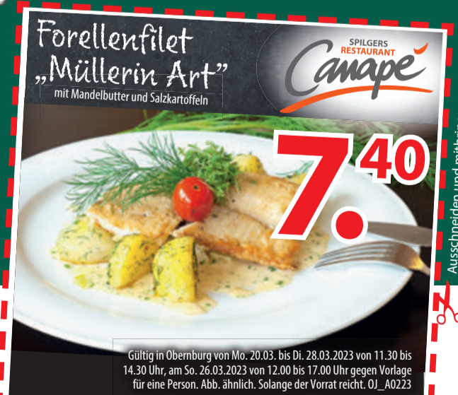
Ausschneiden und mitbringen

Wohn-Center Spilger GmbH & Co. KG • Römerstraße 115 63785 Obernburg • www.spilger.de