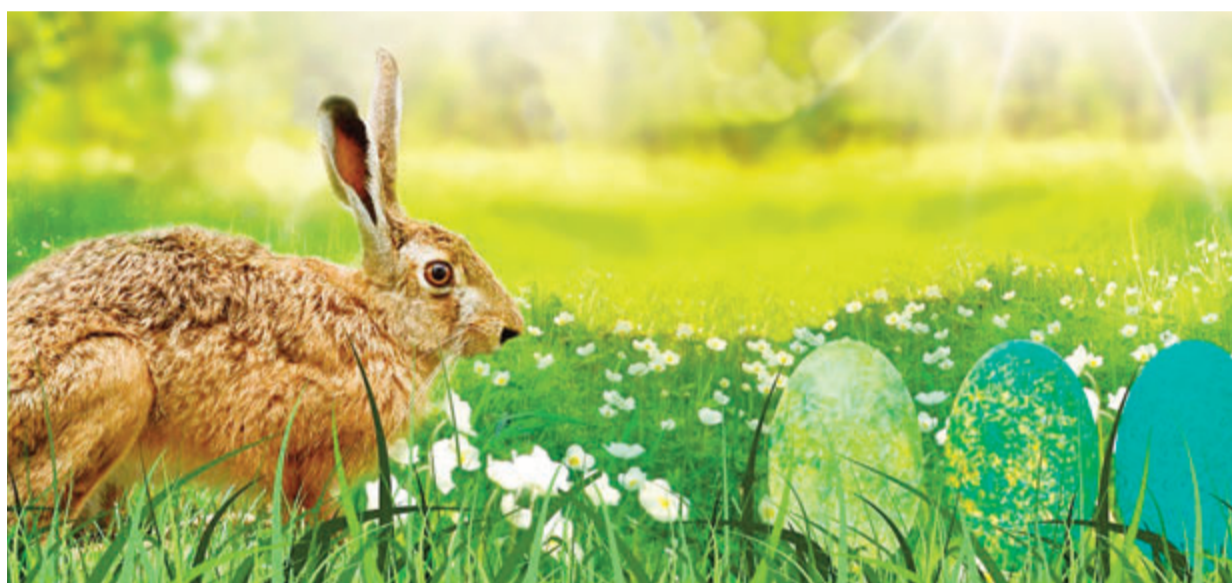
Der Hase schaut über das satte Grün auf die frischen Ostereier.