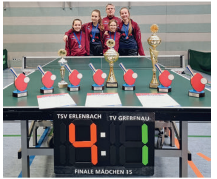
Die Siegerinnen beim Tischtennis.