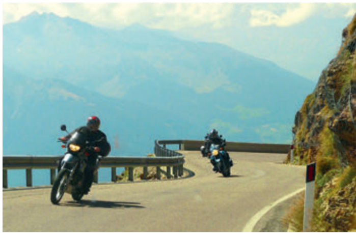
Die Sonne lockt zum Motorradfahren.

Erneut sind in Südhessen zudem wieder drei Biker-Safety-Touren geplant. Im Rahmen dieser circa eineinhalbstündigen Tour, die von polizeilichen Motorradfahrern begleitet wird, werden Ge-