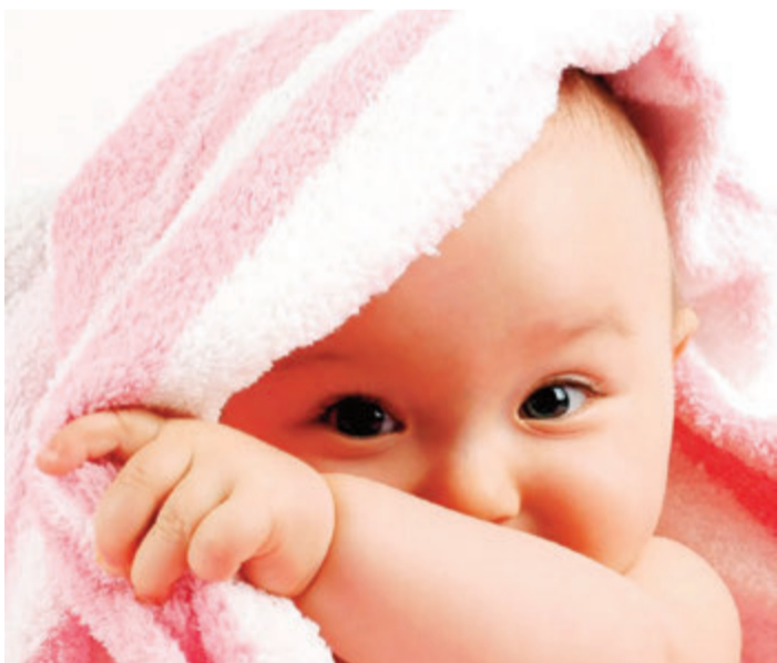
Foto: Jetzt anmelden zu den Yogakursen und zum Säuglingspflege-Kompaktkurs in der Elternakademie am GZO.