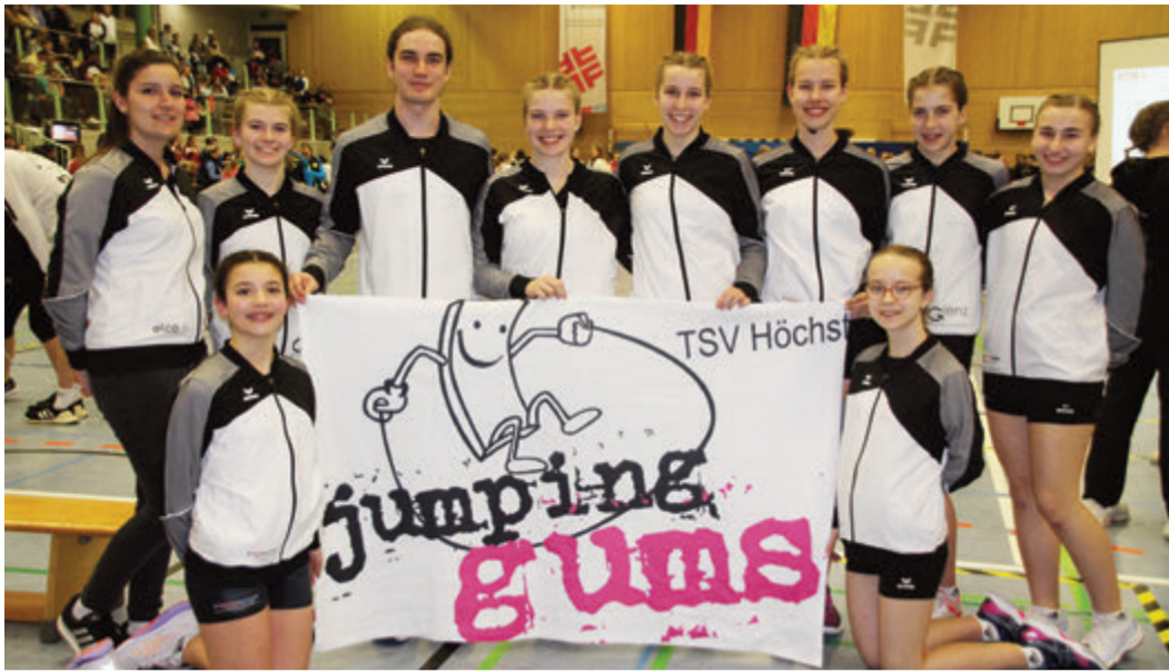
Die strahlenden Teilnehmer an den Deutschen Meisterschaften.