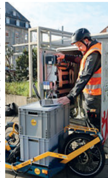
Vielseitig einsetzbar.