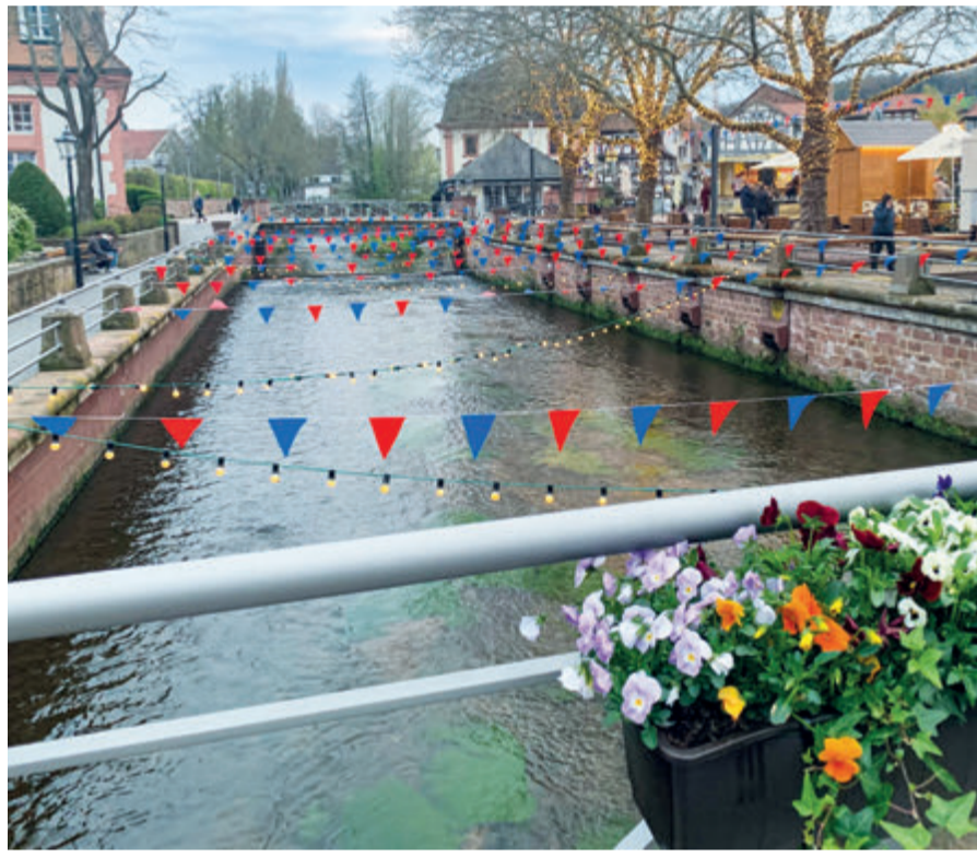
Frühlingserwachen an der Mümling, die Buden stehen schon nahe dem Ufer bereit.

Erbach. Der Frühling beginnt nun nicht nur kalendarisch, sondern auch in Wetter, in der Stimmung und in Erbach am Donnerstag, 20. April. Nach den kalten dunklen Wintermonaten feiert Erbach den Frühling mit einem Markt bis einschließlich 23. April – aber eigentlich sind es zwei: Zum einen der Frühlingsmarkt, zum anderen der Fischmarkt mit den zahlreichen Delikatessen, die das Meer zu bieten hat. Schausteller Sascha Roie wird seine Spezialitäten anbieten. Für das Ohr gibt es über die ganze Zeit Live-Musik. Außerdem bieten die Künstler und Kunsthandwerker der Region so einiges auf, um den Beginn der blühenden Jahreszeit so vielfältig und abwechslungsreich wie möglich zu gestalten. Auch die örtlichen Unternehmen tragen zum Fest bei: So gibt es eine Automobilausstellung, bei der neue und beliebte Modelle von Groß und Klein hautnah erlebt werden.