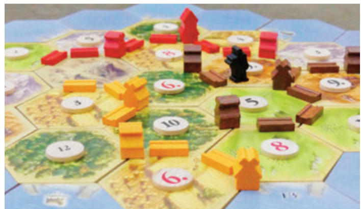
Die Siedler von Catan, berühmtes Spiel von Klaus Teuber

Odenwaldkreis. Viele kennen das Brettspiel „Die Siedler von Catan“ in einer der vielen Varianten, manche kennen auch den Kopf, der dahintersteckte: Klaus Teuber, geboren im Breuburger Stadtteil Rai-Breitenbach, ist am Samstag, 1. April, im Alter von 70 Jahren nach kurzer schwerer Krankheit gestorben. Dem Odenwald blieb er sein Leben lang verbunden, er wohnte in Roßdorf. Obwohl er gelernter Zahntechnikermeister war, begeisterte ihn das Erfinden von Brettspielen schon seit Jahrzehnten. Mit dem Spiel „Barbarossa“ errang er 1988 den Preis „Spiel des Jahres“, zwei Jahre später schaffte er es mit „Adel verpflichtet“ ein weiteres Mal. Auch mit „Drunter & Drüber“ kam er 1991 zu der Ehrung, bevor er 1995 mit den „Siedlern von Catan“ den großen Wurf schaffte. Das Spiel um Ressourcen und Siedlungen wurde zunächst von mehreren Brettspielverlagen abgelehnt, der Kosmos-Verlag nahm sich dessen schließlich an, ohne stark in den Spielaufbau einzugreifen. Das Ergebnis: Über ein dutzend Erweiterungen, übersetzt in 20 Sprachen, verkauft in 40 Ländern. Damit konnte Teuber 1999 das Dentallabor verkaufen und hauptberuflicher Spieleentwickler werden. red