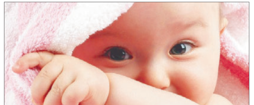
Jetzt anmelden zu den Yogakursen und zum Säuglingspflege-Kompaktkurs in der Elternakademie am GZO.

Infoabend, Säuglingspflege und Yoga im April