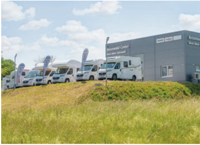
Frische Reisemobile stehen bereit.