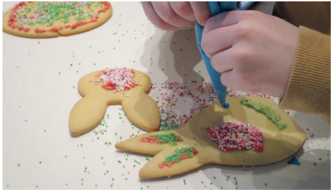
Viel Freude für die Kinder mit den Streusel.

Auch konnten die Kinder mit Geschick, Phantasie und Kreativität basteln. Zur Belohnung versteckte der „Osterhase“ für jedes Kind ein buntes Osterkörnchen voll Schokolade. red