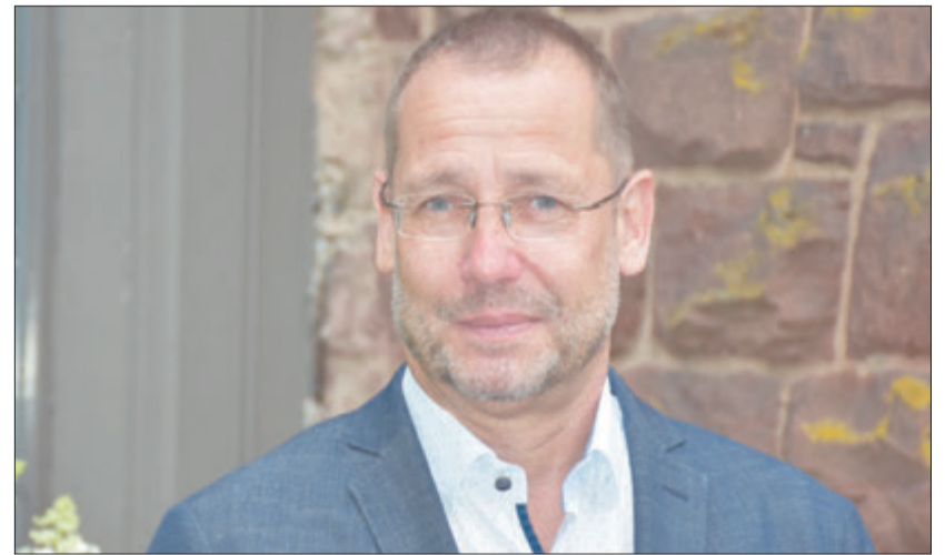
Frank Wedekind ist als Arbeitgeberservice des Kommunalen Job-Centers Ansprechpartner für regionale Unternehmen mit Personalbedarf.

Unterstützung bei der Besetzung offener Stellen für Unternehmen im Odenwaldkreis