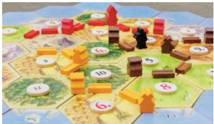
Die Siedler von Catan, berühmtes Spiel von Klaus Teuber

„Adel verpflichtet“ ein weiteres Mal. Auch mit „Drunter & Drüber“ kam er 1991 zu der Ehrung, bevor er 1995 mit den „Siedlern von Catan“ den großen Wurf schaffte. Das Spiel um Ressourcen und Siedlungen wurde zunächst von mehreren Brettspielverlagen abgelehnt, der Kosmos-Verlag nahm sich dessen schließlich an, ohne stark in den Spielaufbau einzugreifen. Das Ergebnis: Über ein dutzend Erweiterungen, übersetzt in 20 Sprachen, verkauft in 40 Ländern. Damit konnte Teuber 1999 das Dentallabor verkaufen und hauptberuflicher Spieleentwickler werden. red