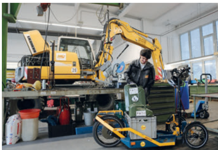
In dieser Werkstatt findet der E-Roller Verwendung.

Auf der Tagesordnung stehen unter anderem die Wahl des Protokollführers, die Jubiläums- und Totenehrungen, verschiedene Berichte, und die Neuwahlen des Vorstandes an. Anträge können bis zum 28. April angemeldet werden. red