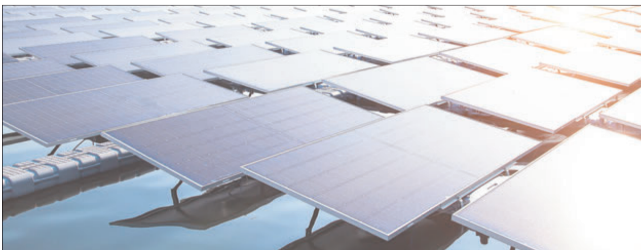
Schwimmende Solar-Panels auf Gewässern bieten viele Vorteile.

Ökostrom von einem Baggersee in Riedstadt