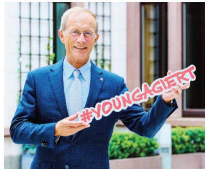
Jung und engagiert, dann können diese Jugendlichen einen Preis bekommen.

Preis und zur Bewerbung gibt es unter: https://www.deinehrenamt.de/youngagiert . red