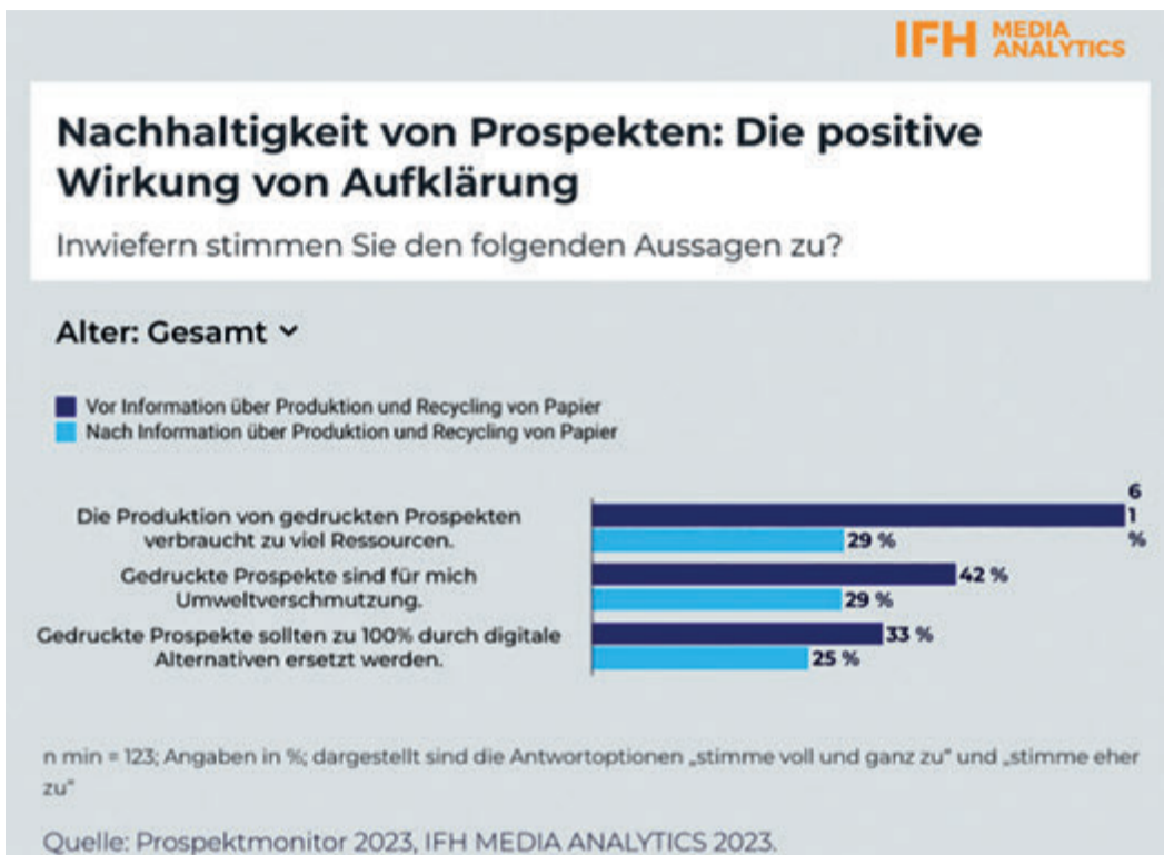
Prospekte sind nachhaltiger, als mancher denkt.

Für die Mehrheit der Konsumenten gehen Nachhaltigkeit und Pro-