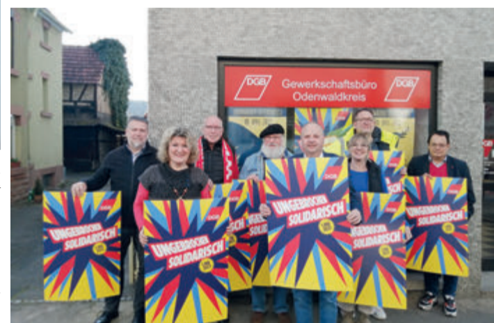
„Ungebrochen solidarisch“ - die Mitglieder des DGB-Kreisvorstandes rufen zur Odenwälder 1. Mai-Kundgebung in Bad König auf.

Bad König / Odenwaldkreis. König ein. Die Auftaktkundgebung „Ungebrochen solidarisch“ - unter diesem Motto stehen die Kundgebungen des Deutschen Gewerkschaftsbundes (DGB) am 1. Mai. Hier lädt der DGB Odenwaldkreis durch die Innenstadt mit anschließender Kundgebung auf der Freizeitanlage Odenwälder Lichtbühne. Ab 12 Uhr startet das Mai-Veranstaltung nach Bad Familienfest red