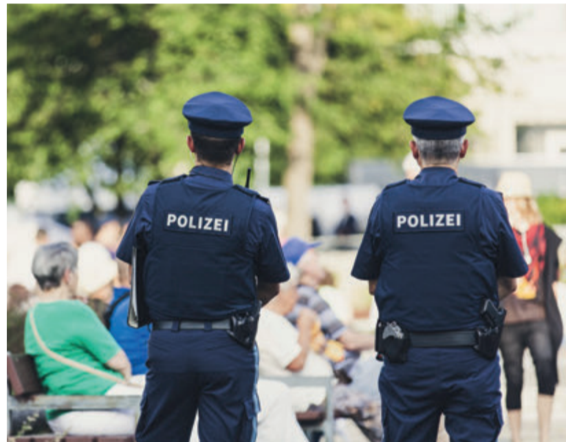
Laut Statistik ist Südhessen die sicherste Region

Die Zahl der Einbrüche und Straßensriminalität stieg im Vergleich zum historischen Tiefstand 2021 stark an.