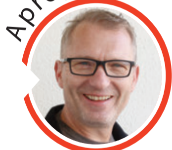
von Volker Zaborowski, Chefredakteur