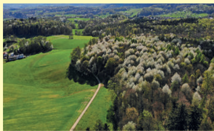
Baumblüte im Weschnitztal