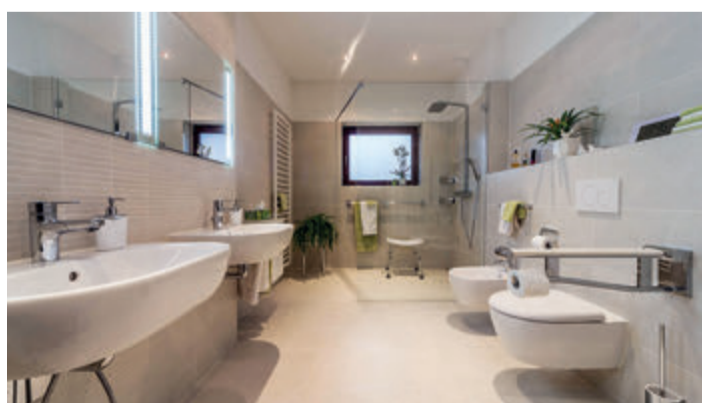
Das barrierefreie Bad für eine luxuriöse Wohlfühlatmosfera.

Der Anspruch an das Bad hat sich im Laufe der Zeit gewandelt: Sollte es früher nur funktional sein, ist es heute ein wichtiger Lebensraum und ein Ort des Wohlbefindens. Da spielt auch das Design eine Rolle: Fugenlose Designs, unabhängig davon, ob Fliesen im Großformat, Tapete oder Putztechnik, lassen ein harmonisches und großzügiges Raumgefühl entstehen, das elegant und – je nach Auswahl der Materialien – wunderbar luxuriös wirkt. Auch das Komfortbad sollte nicht unterschätzt werden. Die zertifizierten Badexperten der Firma Richter beleuchten in einem ersten Gespräch alle Punkte, die im neuen Bad wichtig sind, ob barrierefrei, modern, fugenloses Design oder einfach funktional.