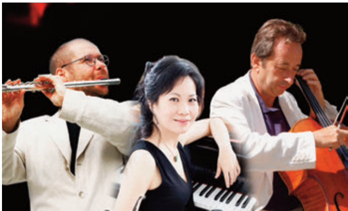
Das Trio Piazzolla präsentiert sich mit Querflöte, Violoncello und Klavier im Schenkenkeller.