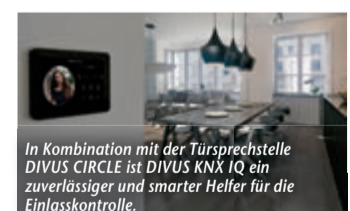
In Kombination mit der Türsprechstelle DIVUS CIRCLE ist DIVUS KNX IQ ein zuverlässiger und smarter Helfer für die Einlasskontrolle.

Sicherheit und Effizienz dank smarterer Lösungen – Ob Gebäudevisualisierung oder digitaler Butler: DIVUS bietet für jedes Bedürfnis eine Lösung (ep) Die Kosten für Strom und Heizung gehen durch die Decke und auch das Klima muss geschont werden. Deshalb sind Lösungen, um die Energieeffizienz unseres Zuhauses zu steigern, mehr als willkommen. Das Stand Alone Panel DIVUS KNX IQ etwa ist das smarte Einsteigerprodukt für alle, die ihre bereits vorhandene Elektroinstallation steuern und kontrollieren wollen. Eine App ermöglicht den Zugriff über das lokale Netzwerk oder von unterwegs über die DIVUS CLOUD. Licht, Beschattung, Temperatur, Musik