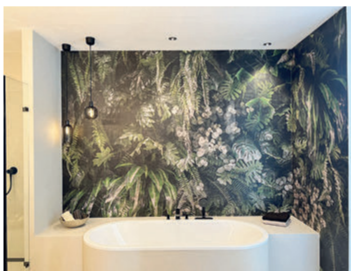
Fugenlose Optik, angenehmer Anblick beim Entspannungsbad.