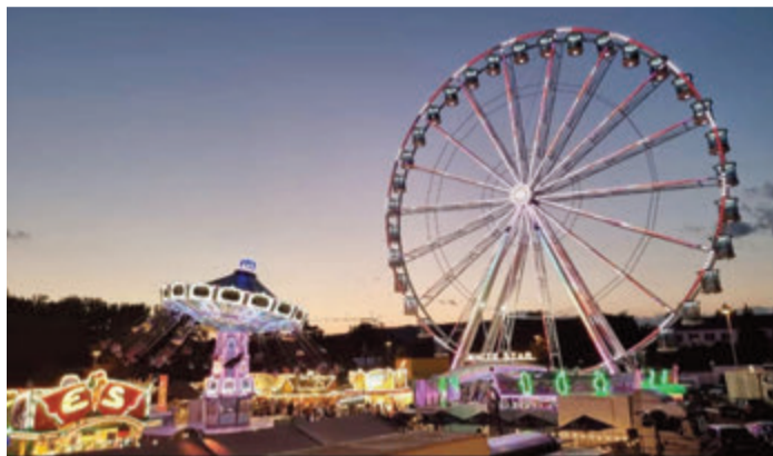
Der Bienenmarkt in vergangenen Jahren

kann am Abend das Großfeuerwerk vom Festplatz aus betrachtet werden. Am letzten Markttag am Sonntag, 4. Juni, findet ab 9 Uhr auf dem Festplatz die Imkermesse des Landesverbands Hessischer Imker mit einer Bienenköniginnenversteigerung statt. Die evangelische Kirchengemeinde lädt für 10.30 Uhr zum Gottesdienst auf dem Bienenmarkt-Festplatz ein. Zum Abschluss bereichert ab 13.30 Uhr der Blumenkorsos das Leben in den Straßen der Stadt mit seinem bunten Blumen- und Kostümschmuck. red