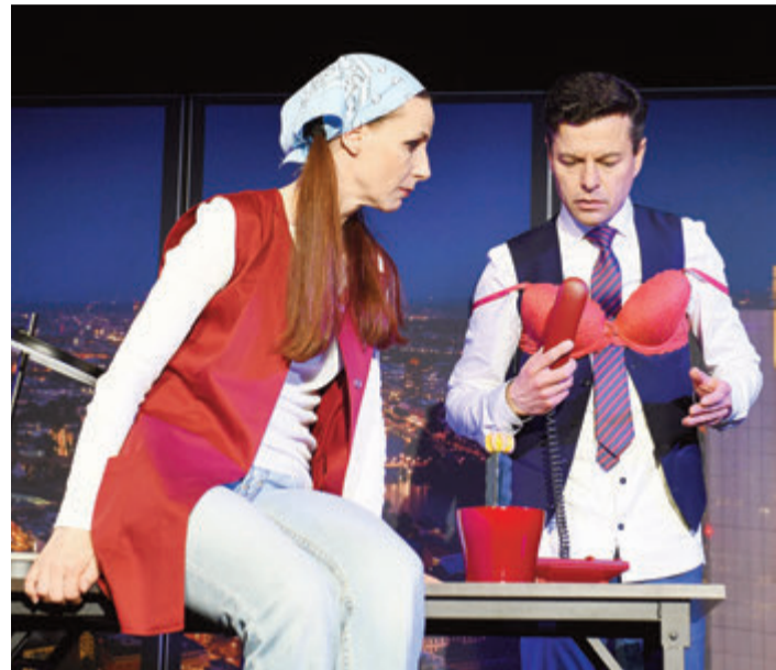
Die Putzfrau und der Direktor am roten Telefon.

zwungen, den Abend miteinander zu verbringen. Bei dieser Begegnung werden nicht nur einige Machenschaften in der Firma aufgedeckt, auch das scheinbar saubere Privatleben von Herrn Fröstl wird durcheinandergebracht. Die Karten für die Komödie von Joeri Burger und Saskia Leder gibt es online unter www.reinheim.de oder bei den bekannten Vorverkaufsstellen. red