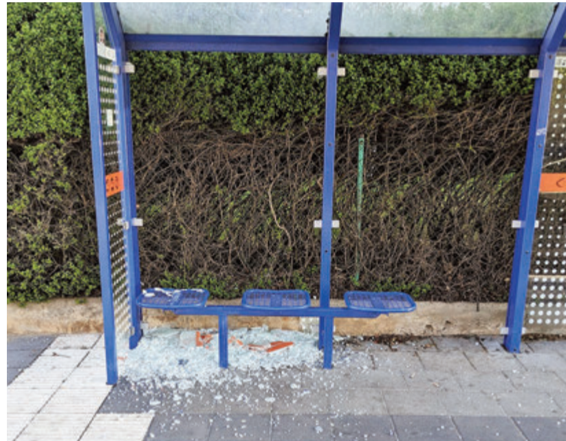
Zerstörte Scheibe an der Bushaltestelle „Memelstraße“ in der Waldstraße.

Landkreis Darmstadt-Dieburg. Anfang letzter Woche kam es zu einer Reihe von Sachbeschädigungen in Groß-Umstadt. An mindestens fünf Fahrzeugen, unter anderem in der Gebrüder-Grimm-Straße und in der Realschulstraße, wurden Scheiben eingeschlagen, die Schaufensterscheibe eines Zeitungsverlages fiel ebenfalls Unbekannten zum Opfer. Nun gerieten laut Polizei weitere Fahrzeuge in Dieburg, Groß-Zimmern, Reinheim, Roßdorf-Gundernhausen und in Otzberg in das Visier von Vandalen.