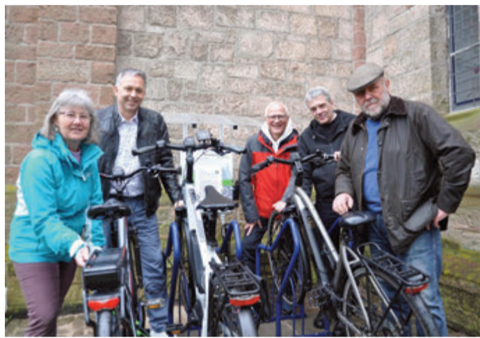
Einweihung der Radwegkirche.