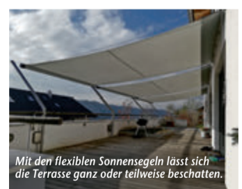
Mit den flexiblen Sonnensegeln lässt sich die Terrasse ganz oder teilweise beschatten.

Cool bleiben! – Flexibles Sonnensegel sorgt für angenehme Temperaturen auf Terrasse und Balkon (ep) Der persönliche Außenbereich ist so individuell in Größe und Ausstattung wie die Bedürfnisse der jeweiligen Nutzer. Eine Gemeinsamkeit haben Balkon- und Terrassenbesitzer aber: Den Wunsch nach einer zuverlässigen Beschattung. Das SHADE-System von SHADESIGN, bestehend aus einem patentierten rollbaren Sonnensegel und viel Zubehör, ist sehr flexibel einsetzbar und punktet on top mit einfacher Handhabung, höchstem UV-Schutz und strapazierfähigem Tuch. Neben den Standard-Varianten – INOX für Terrassen und Balkone, STRUCTURE für eine Wand-zu-Wand-Bespannung sowie CUBE als freistehende Beschattung – stehen durch das modulare System fast grenzenlose Kombinationsmöglichkeiten zur Verfügung. Bei SHADE Twin etwa wird INOX freistehend mit zwei gegenüberliegenden Sonnensegeln aufgestellt, was die beschattete Fläche mal eben verdoppelt. Gleiches gilt für SHADE Multi, hier werden die Segel allerdings nebeneinander platziert. Mehr unter www.gardenplaza.de/shadesign