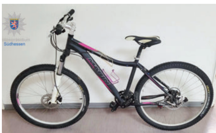
Wer weiß, wem das Rad und der Rahmen gehören?

Breuberg. Mitte März hat die Polizei bei einer Wohnungsdurchsuchung in Breuberg ein Fahrrad sowie einen Fahrradrahmen sichergestellt. Die Beamten gehen davon aus, dass es sich um Diebesgut handelt. Nun wird der Eigentümer ge-