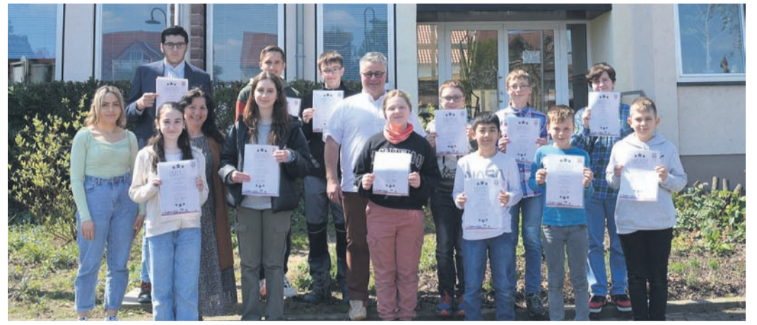
Stolz posieren am Ende eines ereignisreichen Tages alle „Girls und Boys“ mit ihren Urkunden, ihren Betreuungspersonen und Bürgermeister Joachim Schledt vor dem Rathaus.

Idee zur Veranstaltung hatte. Passend dazu wird die Bücherei Münster für alle wissensdurstigen Kinder eine Abteilung rund um Umwelt-Themen einrichten, um diese Themenfelder über die Veranstaltung hinaus weiter kindgerecht aufgearbeitet zu bedienen. Anmeldung: Alle kleinen Forscher, die einen Leseausweis in Münster oder Altheim haben, können sich ab sofort per Email bei l.brunn@muenster-hessen.de von ihren Eltern anmelden lassen (einen Leseausweis erhält man für einmalig 1 Euro). Bitte unbedingt eine Mailadresse, den vollen Namen, Alter und Lesenummer angeben. An die hinterlegten Daten werden die ausführlichen Anmeldeunterlagen sowie alle Infos rund um Treffpunkt (im Gemeindegebiet), benötigte Kleidung usw. geschickt. Die Plätze werden nach Anmeldezeitpunkt vergeben. Die Teilnahme ist kostenlos! Weitere Infos zum Rhöner Umweltmobil gibt es hier: www.bionetzwerk-rhoen.de