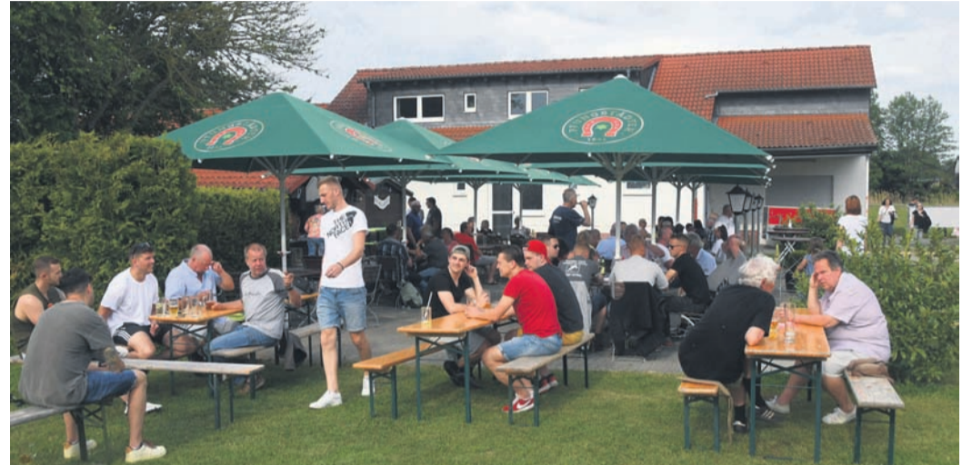
Beim TSV Altheim (hier der Biergarten, hinten das Vereinsheim) konnte die Bestellung eines Notvorstands durchs Amtsgericht Dieburg auf den letzten Drücker abgewendet werden.

fanden die Münsterer dadurch nicht. Dabei sei man an der SVM-Spitze durchaus flexibel, was etwa die Verteilung der Aufgaben angehe, betont Wanitschek. Ein neues Vorstandsmitglied könne sich vor allem in seinem Fachgebiet - beispielsweise Sportbetrieb oder Finanzen - engagieren. Außerdem steigende ein Neuling am Münsterer Mäusberg in einen funktionierenden Verein ein: „Wir stehen auf richtig guten Beinen“, betont Wanitschek. Mehr Mannschaften als der SVM hat im Fußball-Kreis Dieburg kaum ein anderer Klub, „die Mitgliederzahl geht auf die 800 zu, mit neun Schiedsrichtern haben wir im Kreis den Topwert und der Sommergarten 2022 war der erfolgreichste aller Zeiten.“