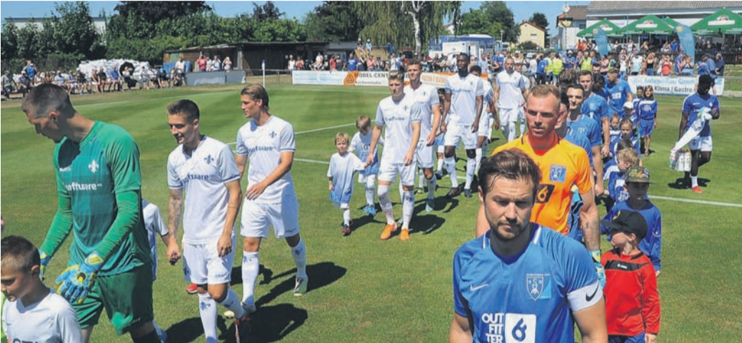
Der SV Münster (hier das Naturrasen-Großfeld, hinten rechts die Sommerterrasse und das Vereinsheim mit Halle) steht insgesamt gut da - nur die Vorstandssuche gestaltet sich schwierig. Die Wahl am Freitag musste abgebrochen werden, am 7. Juli folgt eine Außerordentliche Mitgliederversammlung.

Ortsteil-Klub TSV wendet Auflösung ab, SV-Fußballer müssen Vorstandswahl abbrechen