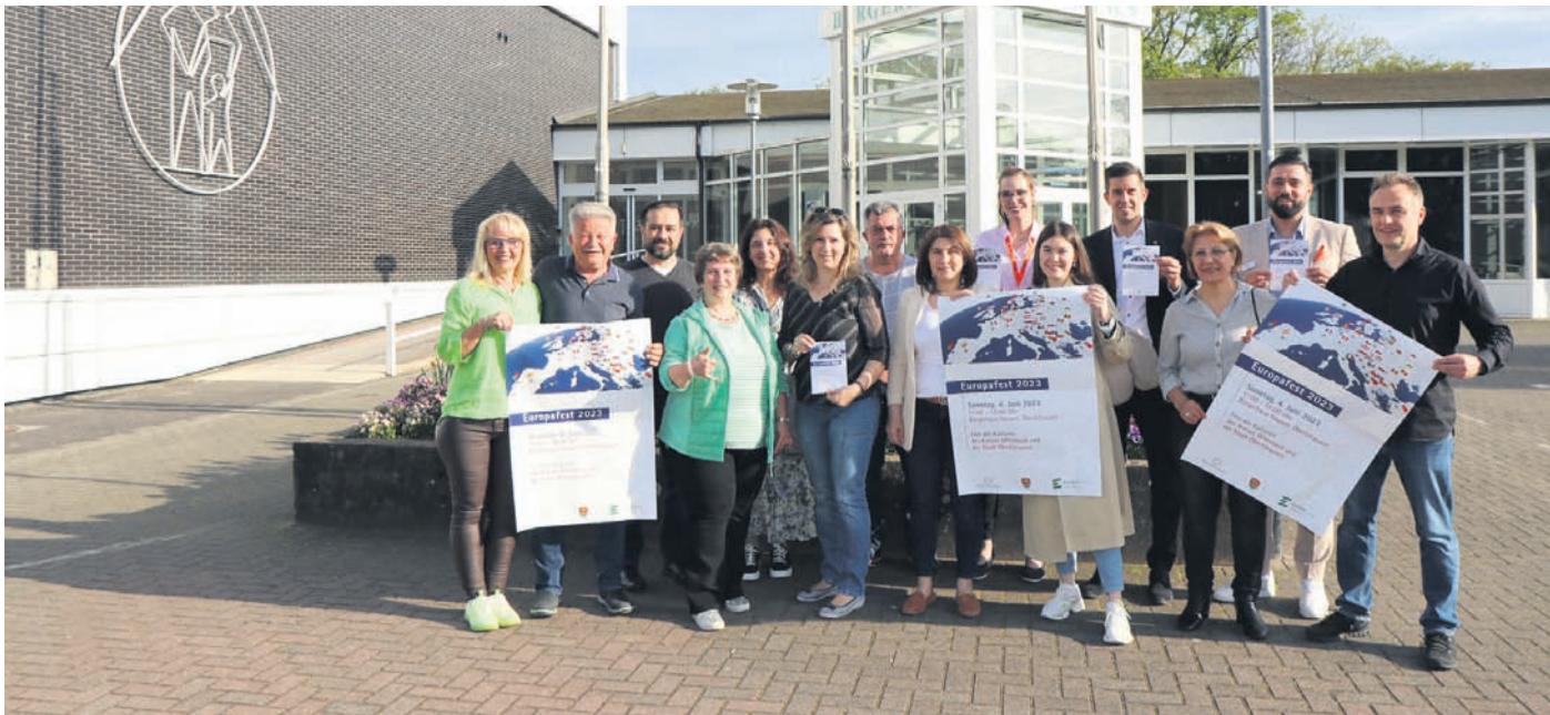
Organisatoren sowie Teilnehmerinnen und Teilnehmer freuen sich bereits aufs diesjährige Europafest. Einige haben sich dazu dieser Tage am Bürgerhaus eingefunden, um Werbung für das Fest, welches am 4. Juni gefeiert wird, zu machen.

prozessionsspinner und damit die gesundheitsgefährdenden Larvenstadien sollen so eingedämmt werden. Ist die Larve eines Nachtfalters noch am Anfang - und hat noch keine giftigen „Brennhaare“ - kann man noch präventiv dagegen vorgehen. Später hilft sonst nur noch das Absperren von Flächen und Absaugen der Nester und Raupen. Schwerpunkte sind in Obertshausen unter anderem der Waldpark, der Beethovenpark, die Friedhöfe und Außenbereiche der Kindertagesstätten.