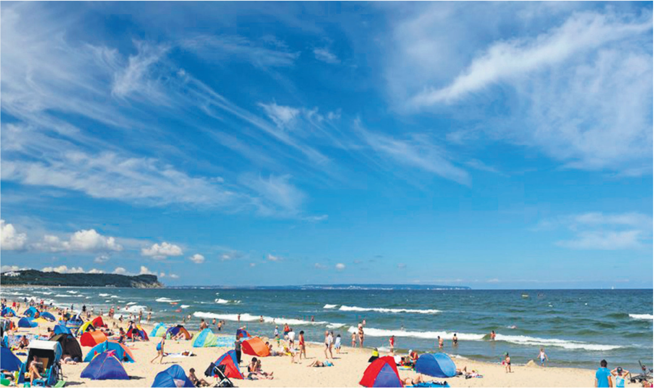
Unbeschwerte Tage am Meer: Die weiten Strände bieten Spaß und Erholung für kleine und große Urlauber.