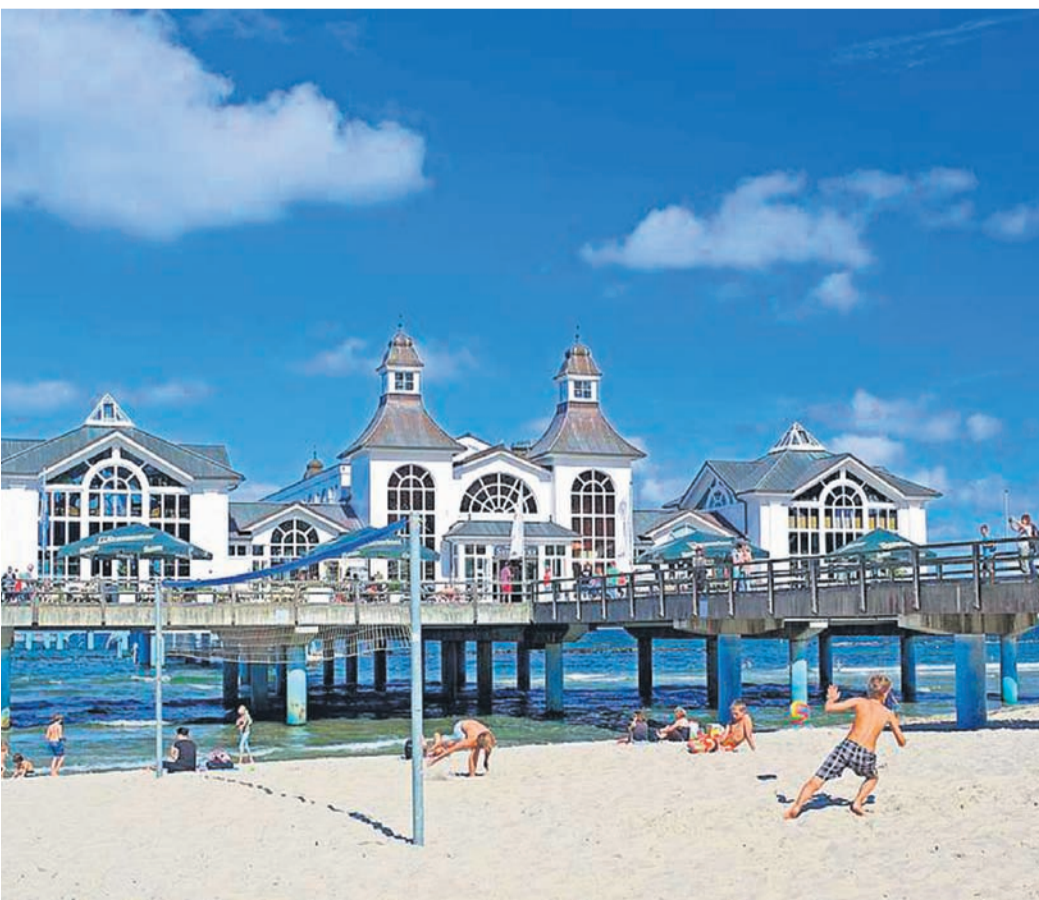
Im Strandkorb relaxen, während die Kids Sandburgen bauen - so sieht Sommerglück für die ganze Familie aus.

Zu einem Bummel lädt die Seebrücke Sellin nur wenige Gehminuten entfernt ein. Sie gilt als die Schönste in Deutschland. Hier lässt es sich herrlich flanieren und schlemmen. Besonders aufregend ist ein Ausflug auf den Meeresboden mit der hier stationierten Tauchgondel.