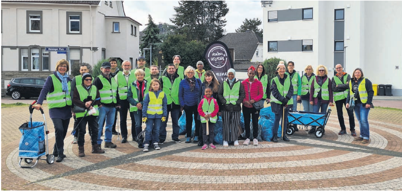
Regelmäßig ruft die Initiative #einfachBÜCKEN zu Müllsammlung aus. Viele helfen dann mit für ein sauberes Obertshausen. Das Foto entstand bei einer früheren Aktion.