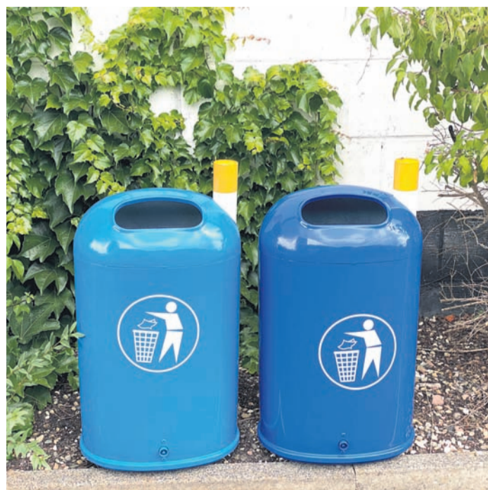
Bereit für die Montage sind diese beiden neuen Mülleimer. Da muss der Abfall doch wirklich nicht mehr auf dem Boden landen.

Gesichter der Müllsammel-Initiative #einfachBÜCKEN sind Undine Zimmer und Bettina Justus - hinter ihnen stecken weitere Helferinnen und Helfer. Bettina Justus setzt sich engagiert dafür ein Fördermittel für den guten Zweck zu akquirieren. Und das tut sie mit Erfolg. Nur so lassen sich all die