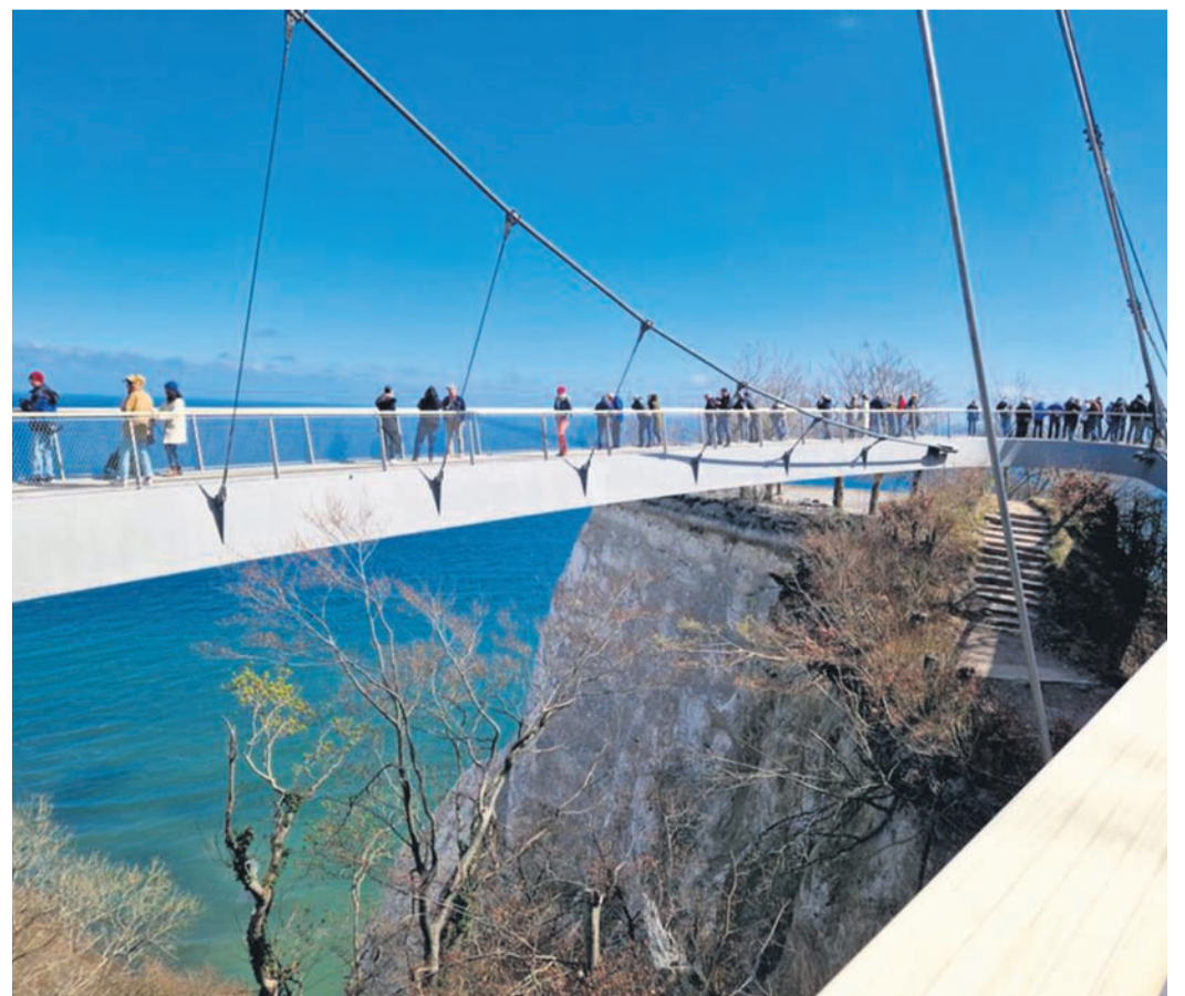
Spektakuläre Aussichten und Abenteuer-Feeling bietet der neue „Skywalk Königsstuhl“.