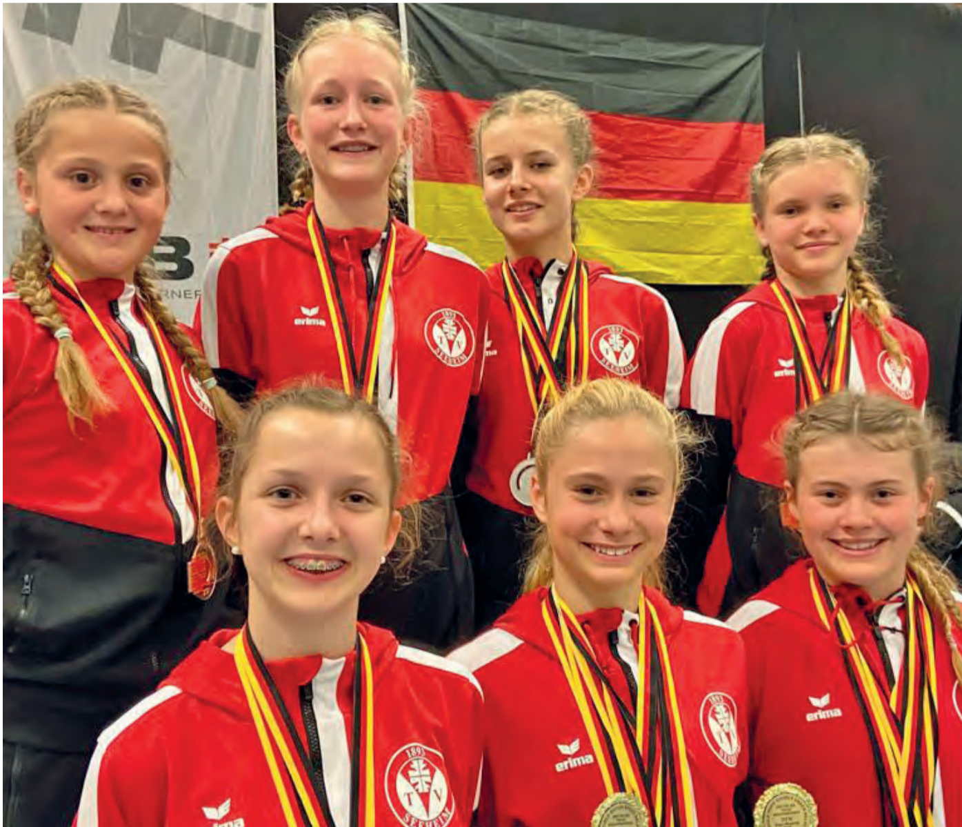
Erfolgreiche Rope-Skipperinnen aus Seeheim.