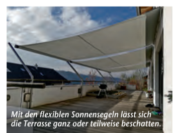
Mit den flexiblen Sonnensegeln lässt sich die Terrasse ganz oder teilweise beschatten.

(epr) Der persönliche Außenbereich ist so individuell in Größe und Ausstattung wie die Bedürfnisse der jeweiligen Nutzer. Eine Gemeinsamkeit haben Balkon- und Terrassenbesitzer aber: Den Wunsch nach einer zuverlässigen Beschattung. Das SHADE-System von SHADESIGN, bestehend aus einem patentierten rollbaren Sonnensegel und viel Zubehör, ist sehr flexibel einsetzbar und punktet on top mit einfacher Handhabung, höchstem UV-Schutz und