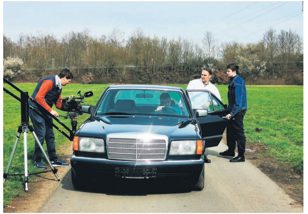
Dreharbeiten zu „Die Jagd nach den Ausbrechern“.

Wochen die Atemschutzüberwachung digitalisiert und das Atemschutzüberwachungssystem gemeinsam mit der Nachbarfeuerwehr, der Freiwilligen Feuerwehr Münster gekoppelt.