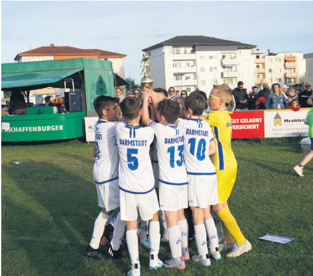
Wieder einmal konnte man hochklassige Mannschaften auf dem Mäusberg locken, sodass man den zahlreichen Zuschauern besten Jugendfußball bieten konnte.