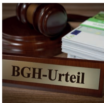
Starkes Urteil für Versicherte.

Bei einem Widerruf erhalten Sie – anders als bei der Kündigung – alle eingezahlten Beiträge ohne Abzug von Maklerprovisionen und Verwaltungskosten zurück. Und nicht nur das: Die Versicherung muss Sie auch an dem mit Ihrem Geld erzielten Anlageertrag beteiligen. So können Sie bis zu 150 % der eingezahlten Beiträge zurückholen. Ein sattes Plus auf Ihrem Konto winkt!