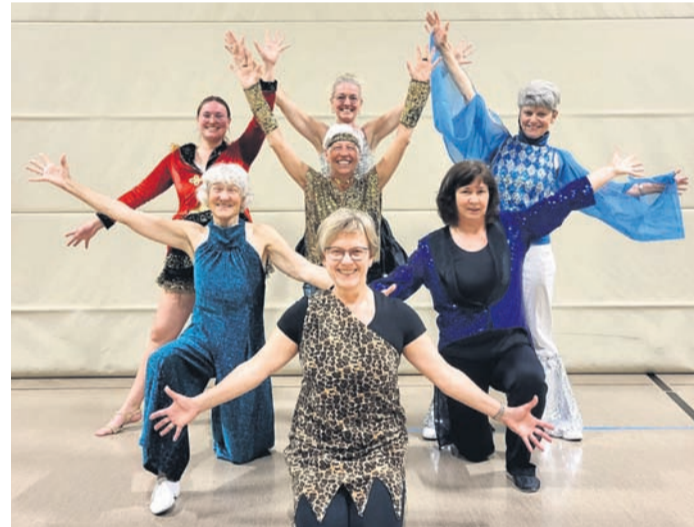
Die Tanzgruppe Just for Fun hat am letzten Dienstag ihren aktuellen Tanz vor begeisterten Freunden und Vereinsmitgliedern aufgeführt. Nun starten sie mit einer neuen Choreografie. Die Gruppe freut sich über neue Tänzerinnen. Kommt gerne dienstags von 21 bis 22 Uhr im Sportzentrum zum Schnuppern vorbei!

Vertrieb: EGRO Direktwerbung GmbH, Obertshausen, Tel. 061 04 - 4970-0