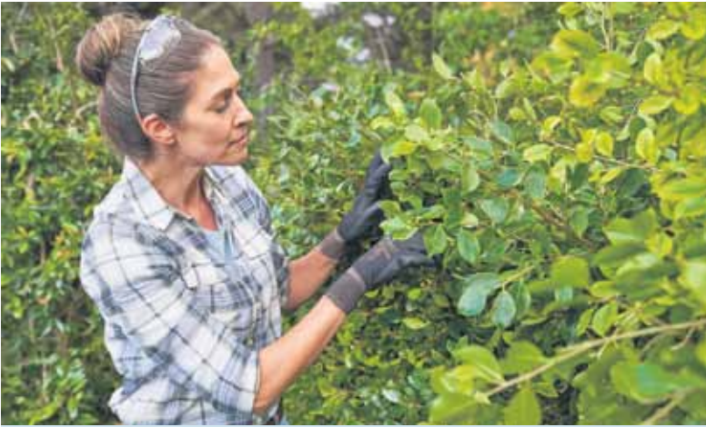
Dicht und grün: So wünschen sich Gartenfreunde ihren natürlichen Sicht- und Windschutz.