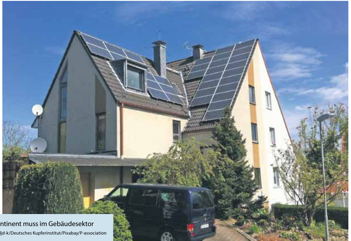
Auf dem Weg zum klimaneutralen Kontinent muss im Gebäudesektor eine Menge investiert werden.

(DJD-K). Der europäische Green Deal setzt ambitionierte Klimaschutzziele. Er fördert die Dekarbonisierung der Energiewirtschaft und möchte Europa bis 2050 zum ersten klimaneutralen Kontinent machen. Auf diesem Weg gibt es noch viel zu tun. Städte sind für 70 bis 80 Prozent des EU-Gesamtenergieverbrauchs und etwa den gleichen Anteil an Kohlendioxid-Emissionen verantwortlich, die Hälfte davon wird alleine von Gebäuden verursacht. Deren Modernisierung hat also hohe Priorität. In der Haustechnik ist Kupfer traditionell ein wichtiger Werkstoff, für die Gebäudeenergiegewende spielt er eine Schlüsselrolle bei der Gewinnung, Verteilung und Nutzung erneuerbarer Energien. Unter www.kupferinstitut.de/mediathek steht eine Broschüre mit mehr Infos zum nachhaltigen Bauen mit Kupfer zum Download bereit.