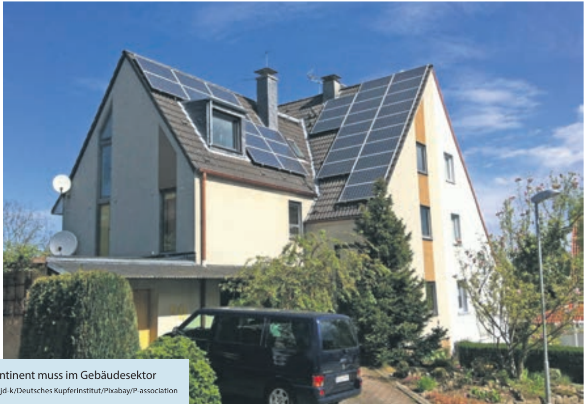
Auf dem Weg zum klimaneutralen Kontinent muss im Gebäudesektor eine Menge investiert werden.

(DJD-K). Der europäische Green Deal setzt ambitionierte Klimaschutzziele. Er fördert die Dekarbonisierung der Energiewirtschaft und möchte Europa bis 2050 zum ersten klimaneutralen Kontinent machen. Auf diesem Weg gibt es noch viel zu tun. Städte sind für 70 bis 80 Prozent des EU-Gesamtenergieverbrauchs und etwa den gleichen Anteil an Kohlendioxid-Emissionen verantwortlich, die Hälfte davon wird alleine von Gebäuden verursacht. Deren Modernisierung hat also hohe Priorität. In der Haustechnik ist Kupfer traditionell ein wichtiger Werkstoff, für die Gebäudeenergiegewende spielt er eine Schlüsselrolle bei der Gewinnung, Verteilung und Nutzung erneuerbarer Energien. Unter www.kupferinstitut.de/mediathek steht eine Broschüre mit mehr Infos zum nachhaltigen Bauen mit Kupfer zum Download bereit.