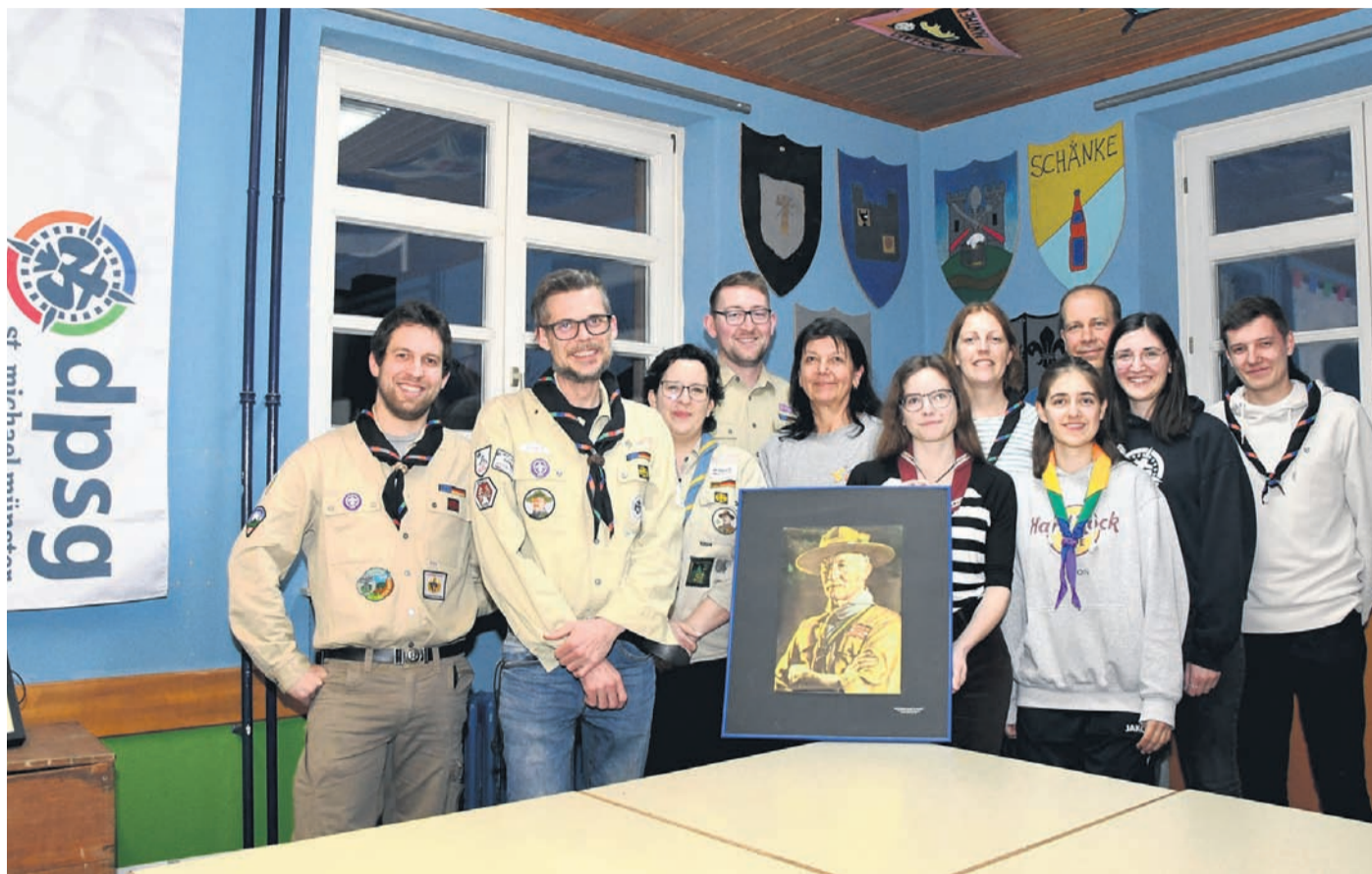
Ein Teil des Stamms St. Michael Münster der Deutschen Pfadfinderschaft St. Georg im Gruppenraum des Schwesternhauses. Davor ein Bild, das Sir Robert Stephenson Lord Baden-Powell of Gilwell („Bi-Pi“) zeigt. Er gilt als Gründer der Pfadfinder-Bewegung.

Ein markanter Gegensatz zur sonst oft schon recht digitalisierten Lebenswelt der heutigen Nachwuchsgenerati-