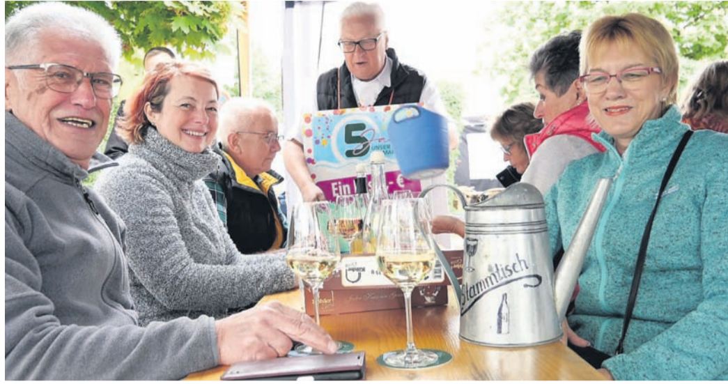
Alle wollten sehen und erleben, was die Geburtstagsparty zu bieten hat.

Allen Prognosen zum Trotz zeigte sich Petrus gnädig. Erst zur vorgerückten Mittagszeit schickte er einen feuchten Gruß von oben, doch das stör-