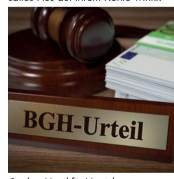
Starkes Urteil für Versicherte.