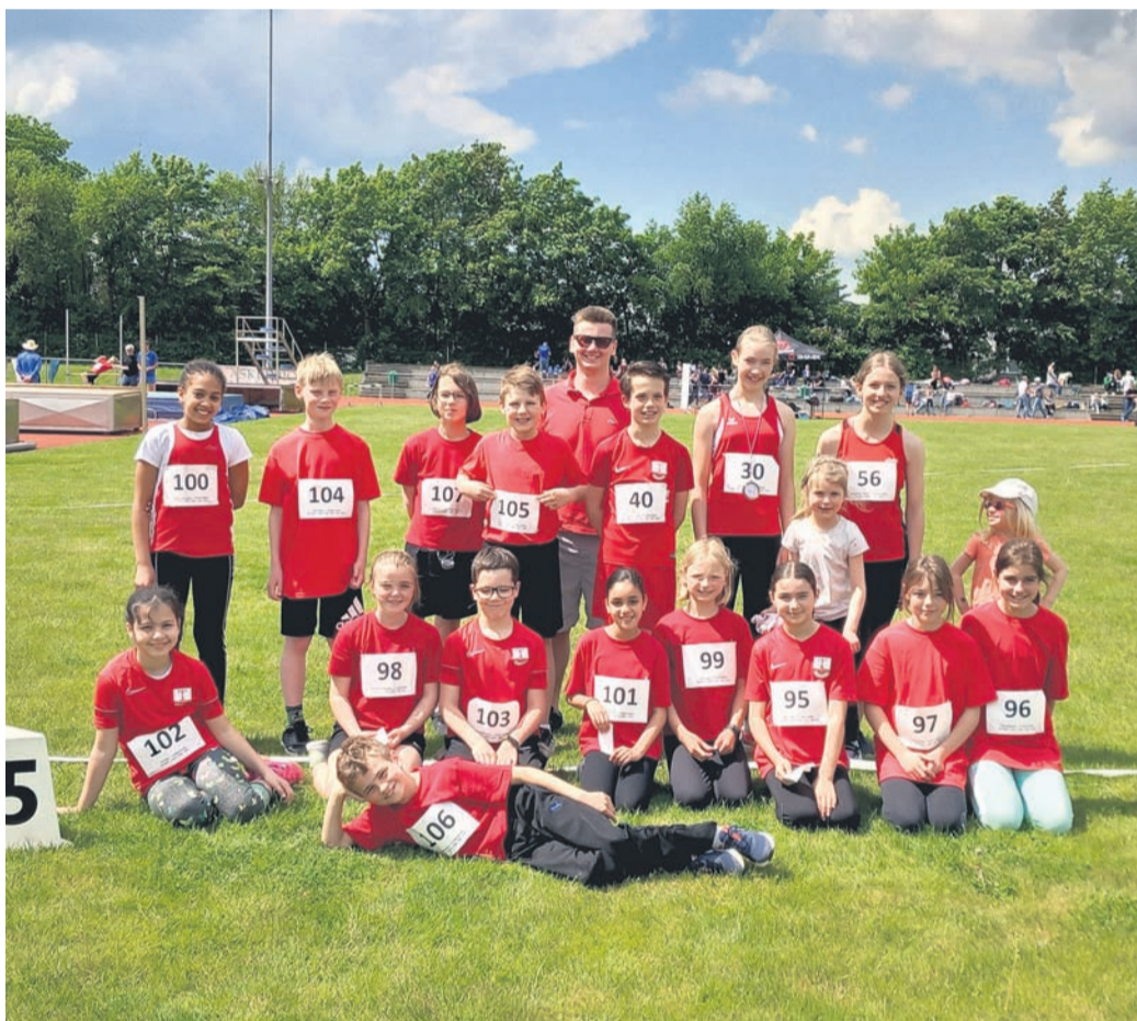
Starke Leistungen boten die Starterinnen und Starter der TS Ober-Roden bei den Leichtathletik-Kreis-Einzelmeisterschaften in Seligenstadt. Es reichte zu mehreren Podest-Plätzen.

freunde Seligenstadt - TSO Herren (16 Uhr), B2 - FC Viktoria Schaaheim (18 Uhr); Sonntag, 21.05.2023: A1 - SV Wehen Wiesbaden U19 (11 Uhr), B1 - SG Rot-Weiss Frankfurt II (13 Uhr), SpVgg Groß-Umstadt - TSO Herren II (15 Uhr), TSO Herren III - KSV Urberach (15 Uhr); Montag, 22.05.2023: 1. FC Germania Ober-Roden I - D2 (18:45 Uhr); Dienstag, 23.05.2023: E1 - Viktoria Klein-Zimmern (17:30 Uhr); Mittwoch, 24.05.2023: FSV Groß-Zimmern II - F3 (17:30 Uhr), F1 - JFV Groß-Umstadt (17:30 Uhr), F2 - SV Münster II (17:30 Uhr), JSG Spachbrücken/Reinheim - D1 (18 Uhr).