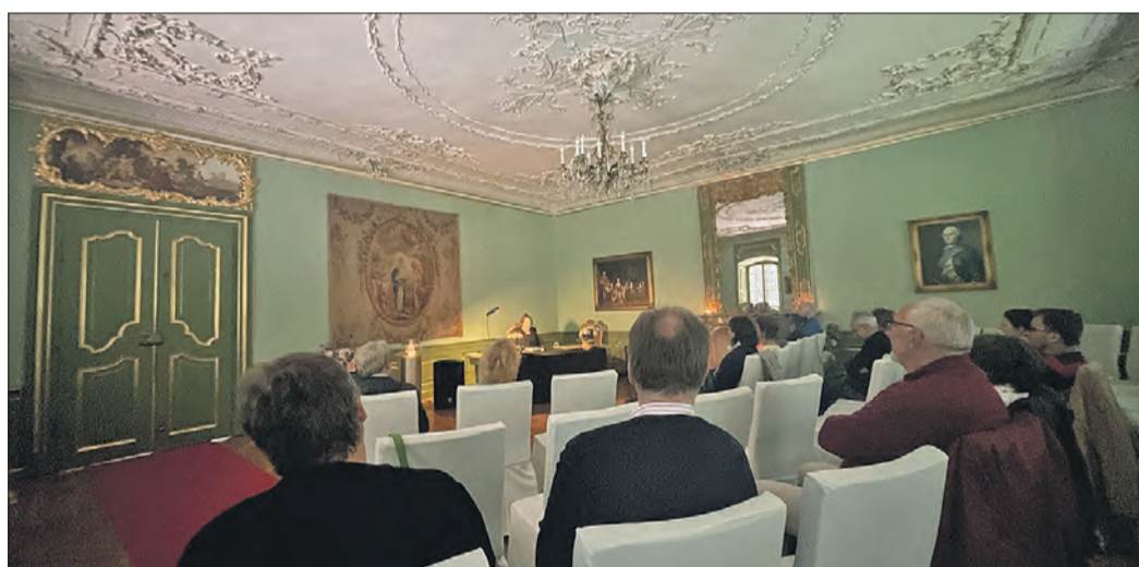
DER LAUSCHSALON IM SCHLOSS.

Bei beiden Veranstaltungen, bei denen insgesamt rund 60 Zuhörerinnen und Zuhörer anwesend waren, gab es ein ausgesprochen positives Fazit zur künstlerischen Darbietung. Diese habe „perfekt in die Szenerie des Schlosses gepasst“, zeigte sich einer der Gäste begeistert. Die Künstlerin habe