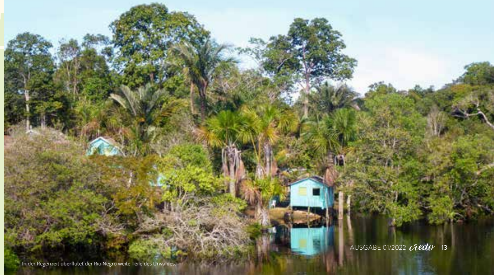
In der Regenzeit überflutet der Rio Negro weite Teile des Urwaldes.

Rafael Schäffer, Adventgemeinde Bensheim ■