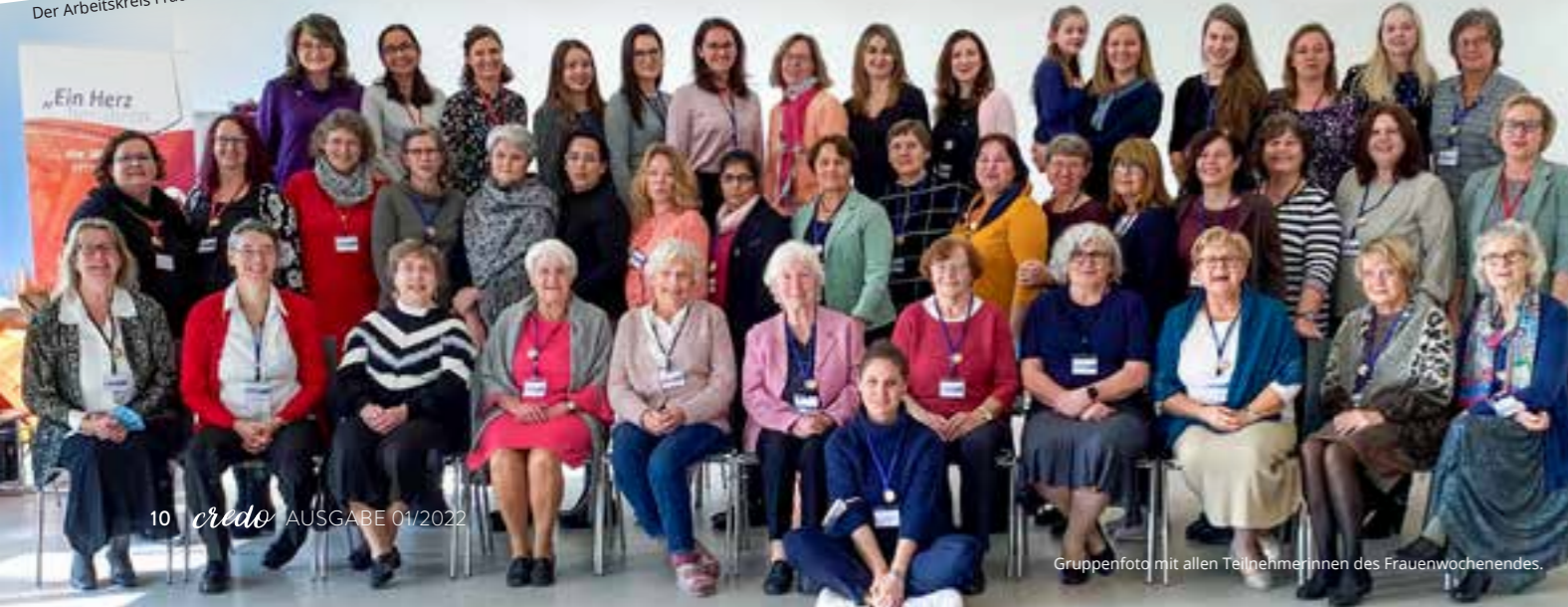
Gruppenfoto mit allen Teilnehmerinnen des Frauenwochenendes.