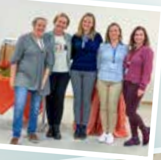
Der Arbeitskreis »girls4christ« unserer Vereinigung.