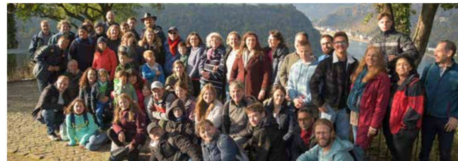
Die ganze Gruppe auf einen Blick.