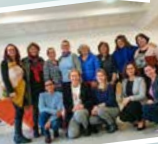
Der Arbeitskreis Frauen unserer Vereinigung.