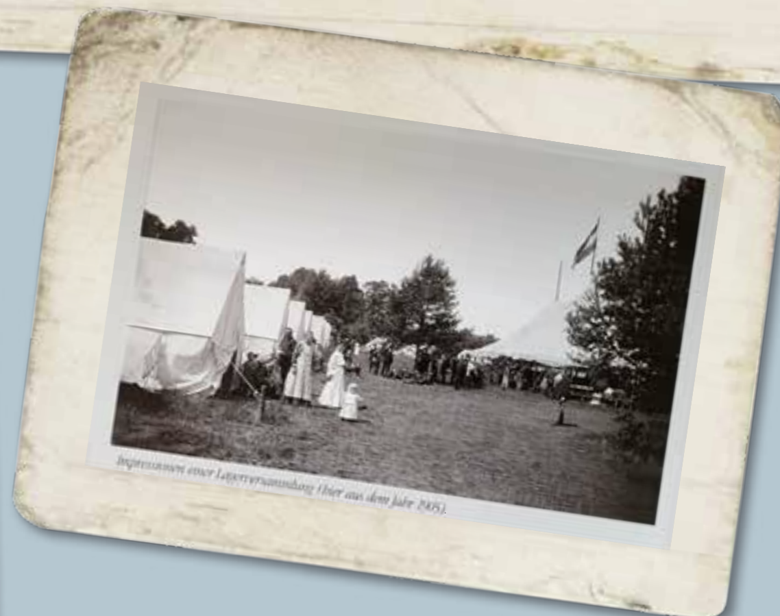
Repressionen einer Lagerplatzanordnung (hier aus dem Jahr 1905).