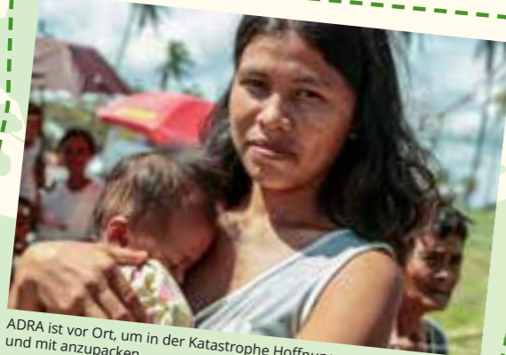
ADRA ist vor Ort, um in der Katastrophe Hoffnung zu spenden und mit anzupacken.

Matthias Münz, Referent Öffentlichkeitsarbeit ADRA ■