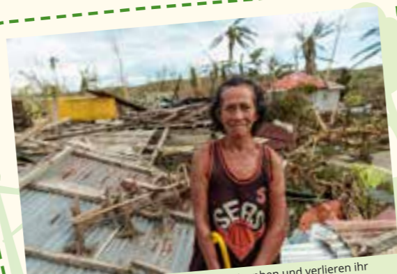
Viele Menschen leiden unter Naturkatastrophen und verlieren ihr Zuhause.

»AUF EINE KATASTROPHE VORBEREITET ZU SEIN, KANN VIELE LEBEN RETTEN«, SAGT EIN TEILNEHMER DER KATASTROPHENSCHUTZSCHULUNG.