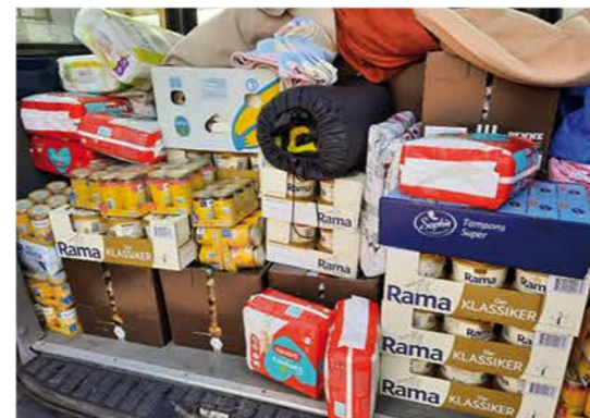
Mit Autos voller Spenden ging es an die ukrainische Grenze.