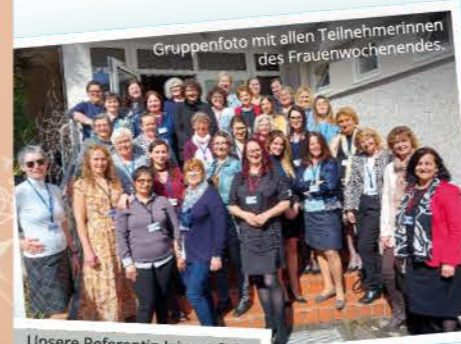
Gruppenfoto mit allen Teilnehmerinnen des Frauenwochenendes.