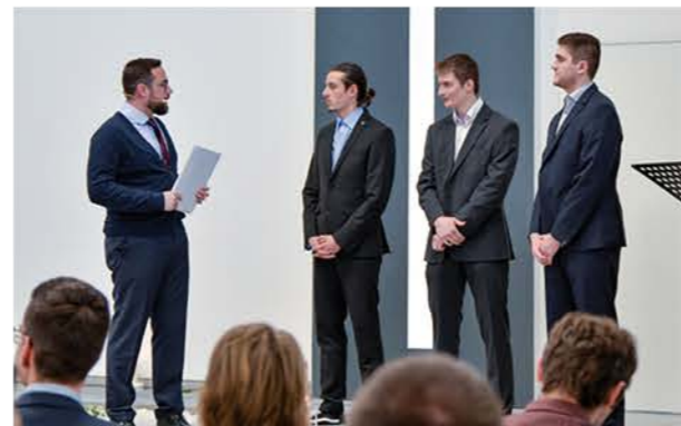
Taufeier in Gladenbach.