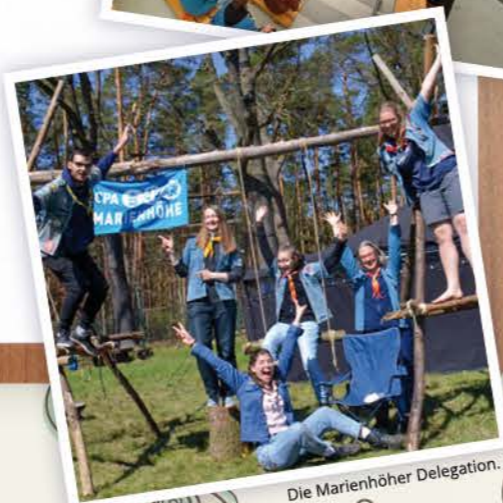
Die Marienhöher Delegation.