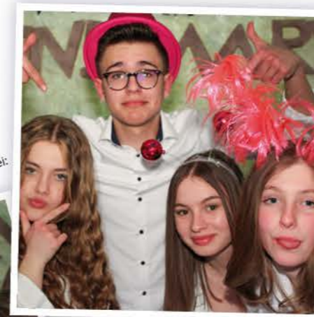
Beim Teens-Wochenende mit dabei: Gute Laune, Kreativität und Spaß.