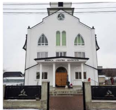
Ein wichtiger Zufluchtsort – eine rumänische Adventgemeinde.