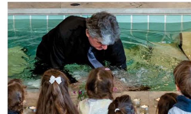
Hinein ins Wasser und so vor allen bekennen, dass ein neues Leben beginnt.