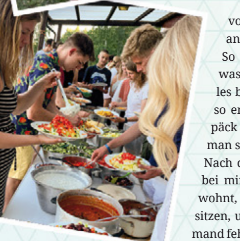
Zeit zum Genießen.

Das waren wilde Wochen! Ungeachtet der Tatsache, dass wir viel auf der Piste waren, viele, viele Stunden in Bussen und Kleinbussen verbracht und neben unseren Zieldestinationen Finnland, Schweden und Kroatien auch Österreich, Slowenien, Norddeutschland und Dänemark bereist haben, war es doch überall Sommer – inklusive guter Laune!