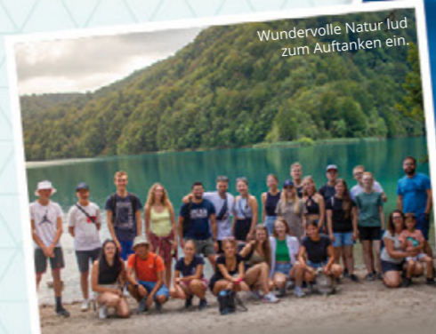
Wundervolle Natur lud zum Auftanken ein.