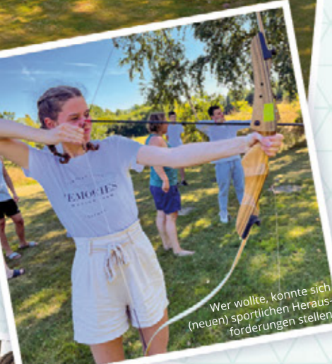
Wer wollte, konnte sich (neuen) sportlichen Herausforderungen stellen.