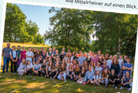
Alle Mittelrheiner auf einen Blick.