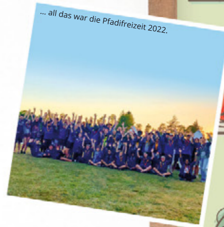
... all das war die Pfadifreizeit 2022.