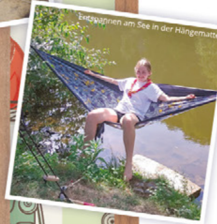
Entspannen am See in der Hängematte.