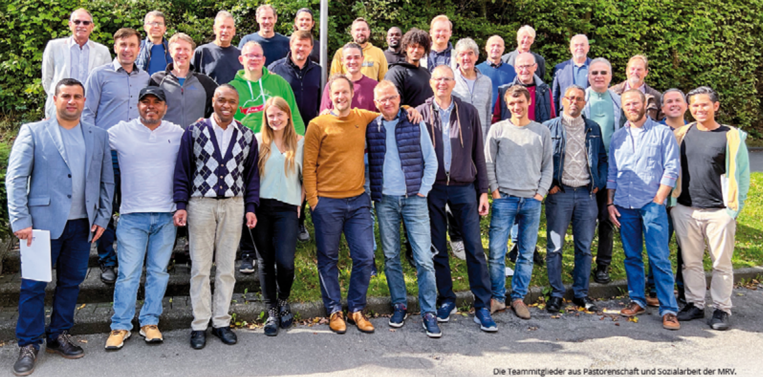
Die Teammitglieder aus Pastorenschaft und Sozialarbeit der MRV.