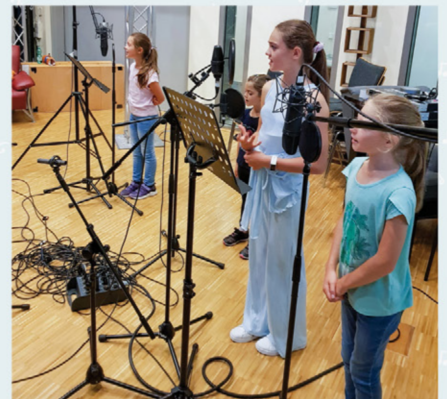
Auch junge Musikerinnen waren dabei und hatten Spaß am Singen.