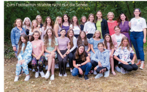
Zum Fototermin strahlte nicht nur die Sonne.

Es war schon ein Hin und Her, bis das diesjährige Wochenende der »girls4christ« (»G4C«) dann doch stattfinden konnte. Letztlich wurde es wunderschön mit 20 großartigen Mädchen.