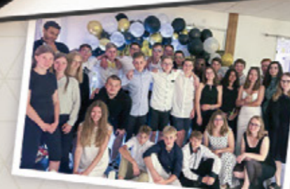
Für den Galaabend warfen sich alle in Schale.