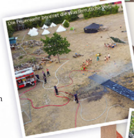
Die Feuerwehr bereitet die Wasserrutsche vor.