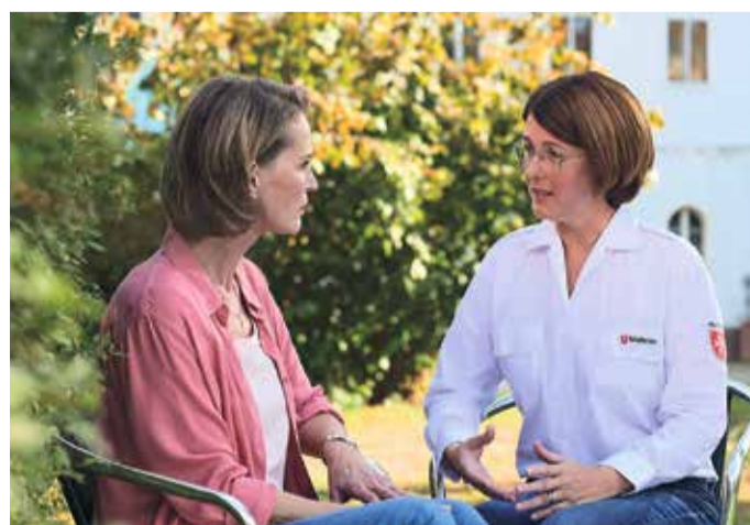
Oft gibt es viele Fragen rund um eine Patientenverfügung – die Malteser bieten fachliche Beratung.

Anmeldung erforderlich unter: hospizdienst-frankfurt@malteser.org oder Tel. 069/94210556