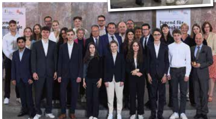
Teilnehmer der Diskussionsrunde „Jugend für Demokratie“.