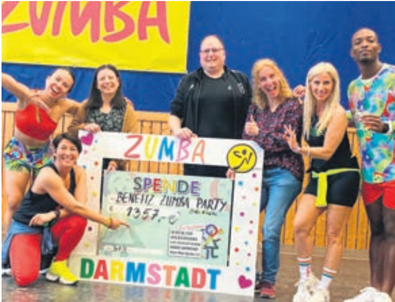
Eine von ZUMBA begeisterte Fangemeinde freute sich bei der Spendenübergabe sehr über den Erfolg.