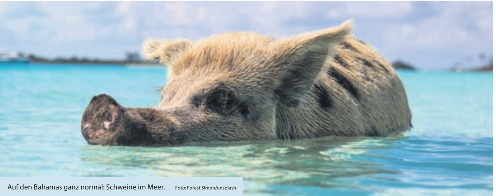
Auf den Bahamas ganz normal: Schweine im Meer.