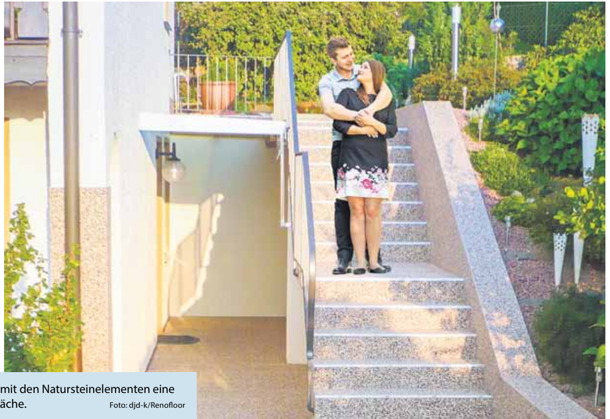
Terrasse und Treppenstufen erhalten mit den Natursteinelementen eine ansprechende und trittsichere Oberfläche.

(DJD-K). Grüner Daumen nach oben: 29 Prozent der Menschen in Deutschland zählen laut Statista das Gärtnern zu ihren liebsten Hobbys. Entsprechend hoch sind gleichzeitig die Ansprüche an die Einrichtung und Möblierung des Freiluftwohnzimmers. Alte, lose Bodenplatten mit Rissen und Ausblühungen stören das Gesamtbild einer gepflegten Terrasse. Für ein schnelles Sanieren eignen sich Natursteinteppiche wie von Renofloor. Hochwertige Quarz- oder Marmorkiesel sind dabei mit einem transparenten Bindemittel gebunden, die Platten lassen sich vom Heimwerker einfach verlegen und per Klicksystem miteinander verbinden. Eine Drainage für einen zuverlässigen Witterungs- und Näserschutz ist ebenso integriert wie eine trittsichere Oberfläche. Unter www.renofloor.de gibt es mehr Details.