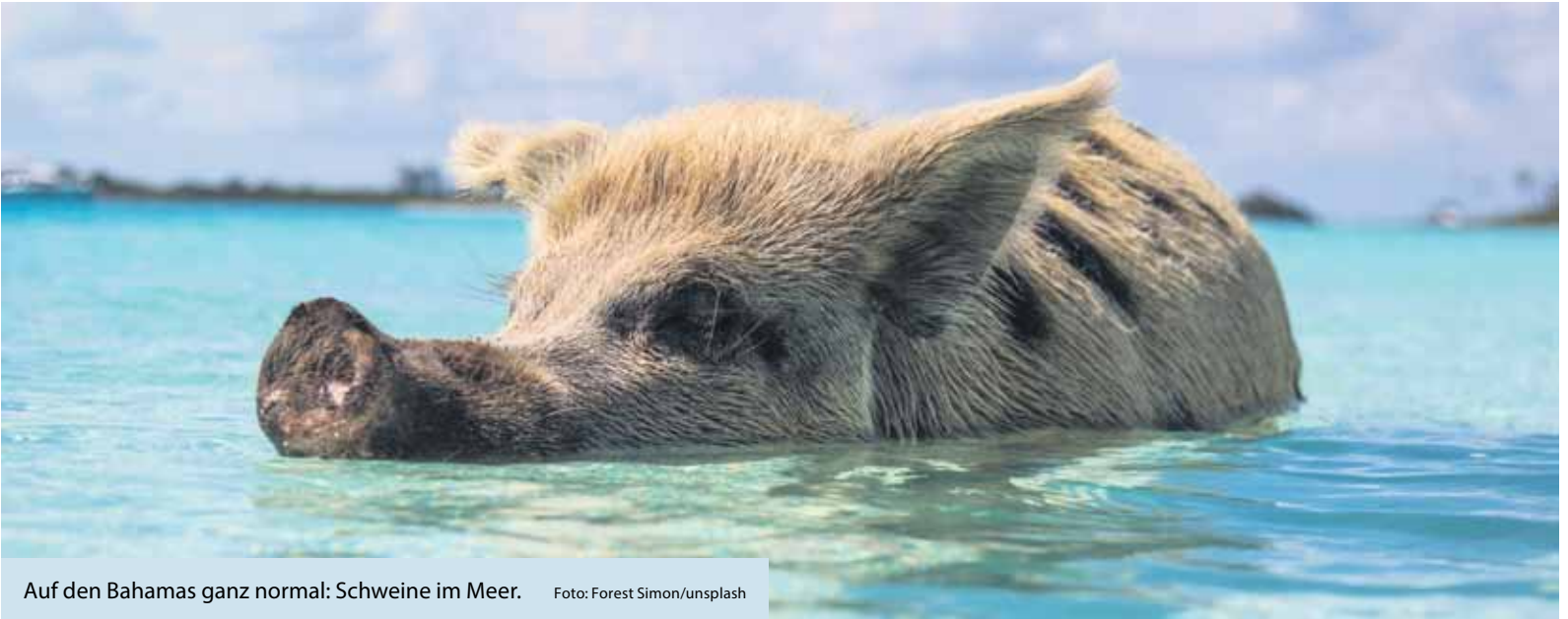
Auf den Bahamas ganz normal: Schweine im Meer.