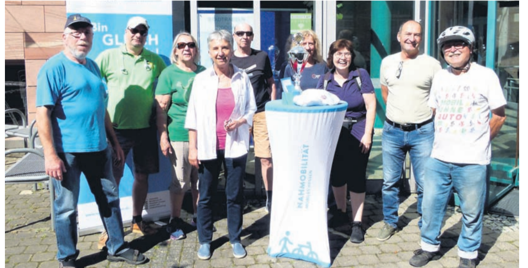
Das Team der Rodgauer Grünen freut sich über weitere Mitradler.

Die Grünen bitten um intensive Beteiligung und Online-Anmeldung über https://www.stadtradeln.de/rodgau . Dort die Kommune Rodgau auswählen und sich einem der Rodgauer Teams wie z.B. „Grüne Alltagsradler:innen“ anschließen