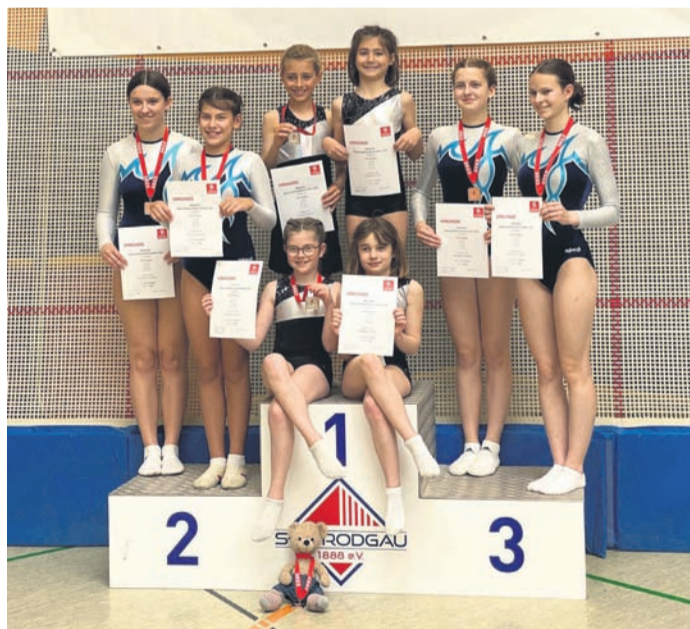
Die Mannschaften der SKG Rodgau belegten in den Teamwettbewerben die Plätze zwei und drei.