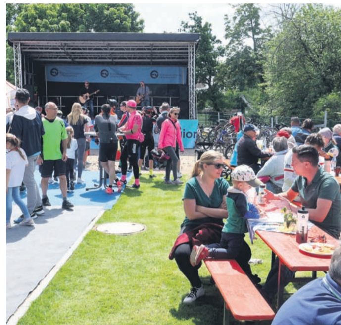
Nach den Radtouren wurde groß gefeiert.

verschiedener Tanzgruppen des Vereins sowie ein Kinderprogramm. Das Radtouren-Event und das Vatertagsfest war eine von zahlreichen Veranstaltungen zum Jubiläum „111 Jahre Sportfreunde“, das in den kommenden Monaten zahlreiche Veranstaltungen umfasst.