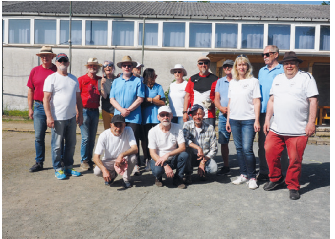
Heimspiel gegen Gross-Gerau im SGA Boudrome

Die meisten Arheilger kennen sie bestimmt und sehen sie hin und wieder beim Abendspaziergang am „Boulodrome“ am Woogsweg 1, Ecke Jakob-Jung-Straße: die Spieler und Spielerinnen der SGA Boule-Abteilung.