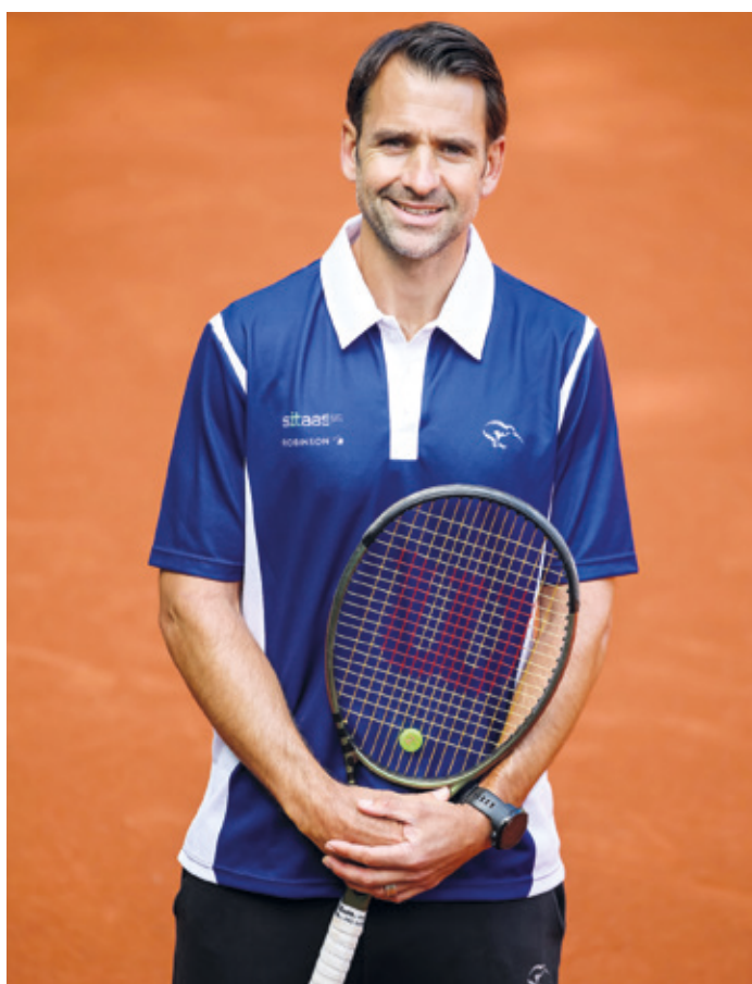
Nicolas Kiefer kommt am 17. Juni zum Jubiläumsfest des Tennisclubs Blau-Weiß Erzhausen.

Nicolas Kiefer ist einer der erfolgreichsten deutschen Tennisspieler aller Zeiten. Höhepunkte seiner Karriere waren das Viertelfinale bei den Australian Open 2000, dem ersten der vier Grand-Slam-Turniere in jedem Jahr, und die daraus folgende Platzierung auf Rang 4 der ATP-Weltrangliste. Bei den Olympischen Spielen in Athen 2004 gewann Kiefer an der Seite von Rainer