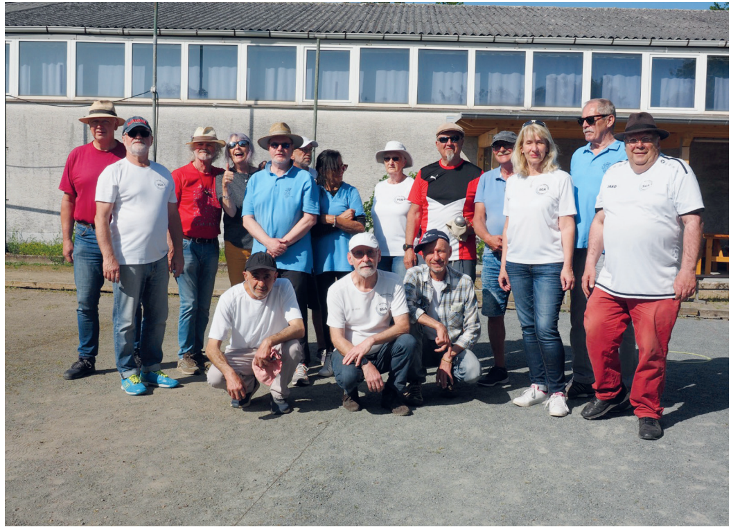
Heimspiel gegen Gross-Gerau im SGA Boulodrom

Die meisten Arheilger kennen sie bestimmt und sehen sie hin und wieder beim Abendspaziergang am „Boulodrome“ am Woogsweg 1, Ecke Jakob-Jung-Straße: die Spieler und Spielerinnen der SGA Boule-Abteilung.