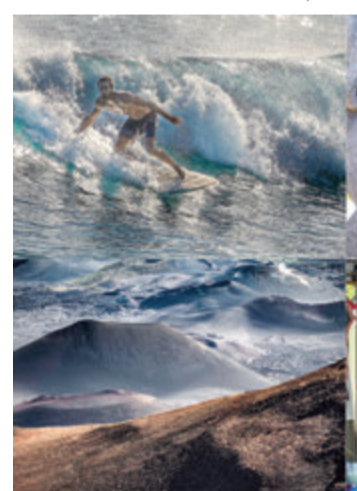
Eindrücke aus Hawaii.

Der Eintritt ist kostenlos, die Veranstalter bitten um eine Spende. Wer am 2. Juni verhindert ist, kann trotzdem spenden unter dem Stichwort „Crumbach hilft der Lebenshilfe“ auf das Konto der Sparkasse Odenwald DE 72508519520071364244 oder Volksbank Odenwald DE 92508635130001633970. Spendenquittungen werden ausgestellt. red/ Dieter Preuss