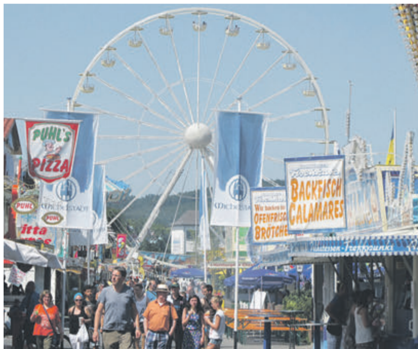
Riesenrad, Kettenkarussell und eine neue Achterbahn – das sind nur einige Attraktionen auf dem Bienenmarkt.

Rings um den Vergnügungsmarkt haben etwa 80 Händler mit den unterschiedlichsten Waren ihren Platz bezogen. Zum Rahmenprogramm gehört das Kinderfest, welches von den Michelstädter Schulen am Mittwoch, 31. Mai, von 15