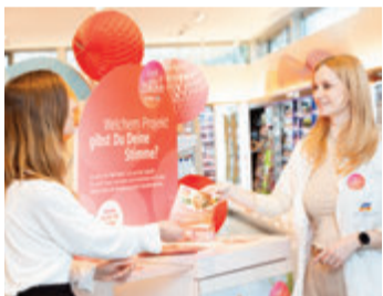
Diese beiden haben Lust auf Zukunft.

zierten Partner bei der Abstimmung im dm-Onlineshop fördert dm mit 10.000 Euro, der zweitplatzierte Partner erhält eine Spendensumme in Höhe von 5.000 Euro. Informationen rund um 50 Jahre dm, die Zukunftsthemen, weitere geplante Aktionen und die dm-Zukunftswocche im September gibt es unter dm.de/lust-auf-zukunft. red