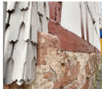
Fachwerk und Buntsandstein prägen historische Bauten im Odenwaldkreis.

Michelstadt. Historische Bauten sind im Fokus des Odenwald-Dialogs am Mittwoch, 24. Mai, ab 19.30 Uhr in der Odenwaldhalle.