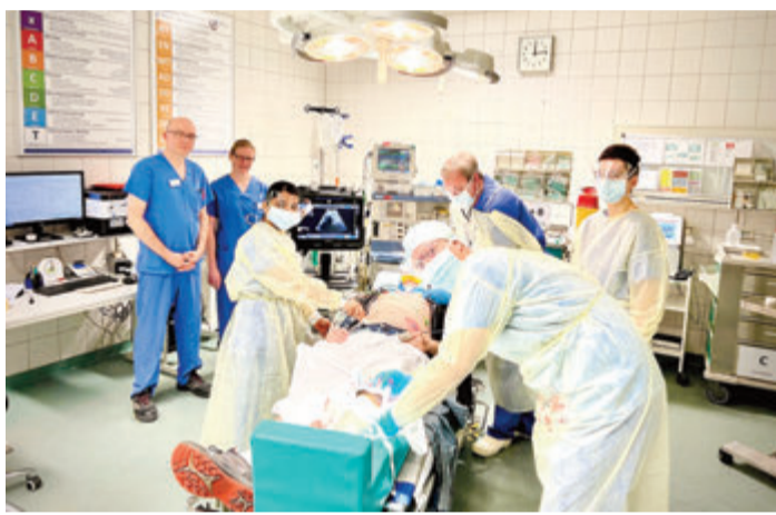
Simulation für den Ernstfall: Das Team in der Notaufnahme.