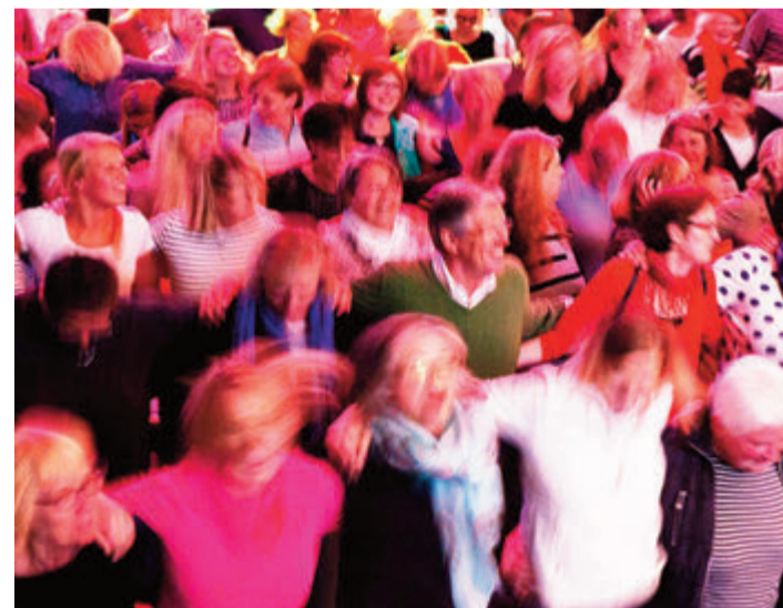
Das Rudelsingen sorgt für Begeisterung im Publikum.

Groß-Umstadt. In der Stadthalle veranstaltet das Kulturmanagement der Stadt am Mittwoch, 14. Juni, ab 19.30 Uhr ein Rudelsingen mit Uli Wurschy und Volker Becker. Bekannte Lieder werden vom Publikum als Chor zusammen gesungen. Dabei treffen Rockklassiker, Schlager, Chansons und Radio-Hits auf Kinderlieder. Karten gibt es auf der Website www.rudelsingen.de oder bei Verfügbarkeit an der Abendkasse. Der Eintritt kostet im Vorverkauf 13 Euro und an der Abendkasse 14 Euro, Einlass ist um 18.30 Uhr. red