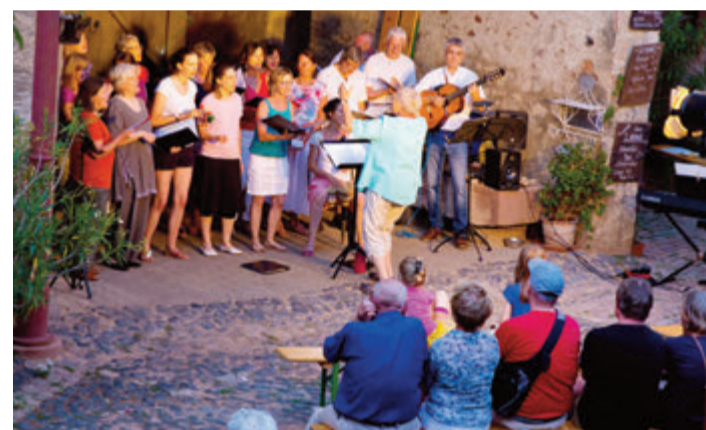
Die SingerKlynger beim Konzert 2022.