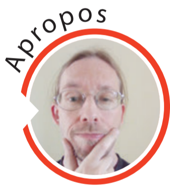
von Sven Iwertowski, Redaktionsleiter

Groß-Umstadt. Zwischen Samstagabend, 13. Mai, und Sonntagmorgen, 14. Mai entwendeten Diebe einen Anhänger von einer Wiese in der Forsthausstraße. Bei dem Anhänger handelte es sich um einen Meterholzwagen. Hinweise an Tel.: 06151-9690. red