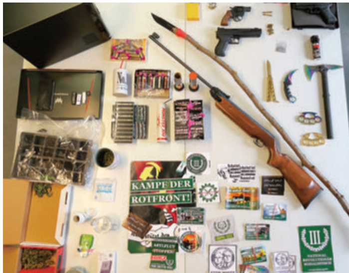
Schusswaffen, Drogen, Propagandamaterial und ein selbstgebastelter Speer sind nur einige der sichergestellten Gegenstände.

Hessen/ Odenwaldkreis. Hessenweit durchsuchte vergangene Woche die Polizei die Räume von dreizehn Personen, die dem rechten Spektrum zuzurechnen sind. Durchsucht wurden Wohnungen in den Landkreisen Marburg-Biedenkopf, Gießen, Rheingau-Taunus, Bergstraße, Odenwaldkreis, Offenbach, Main-Kinzig sowie Vogelsberg. Wie ein Polizeisprecher dem Odenwälder Journal mitteilte, wurde eine Wohnung im westlichen Odenwaldkreis durchsucht.