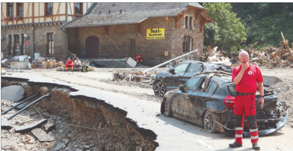
Schockiert über die Schäden der Flut zeigt sich dieser Mitarbeiter des Deutschen Roten Kreuzes.

DRK-Leitung aus Ahrweiler dankt für Hilfe aus dem Odenwald