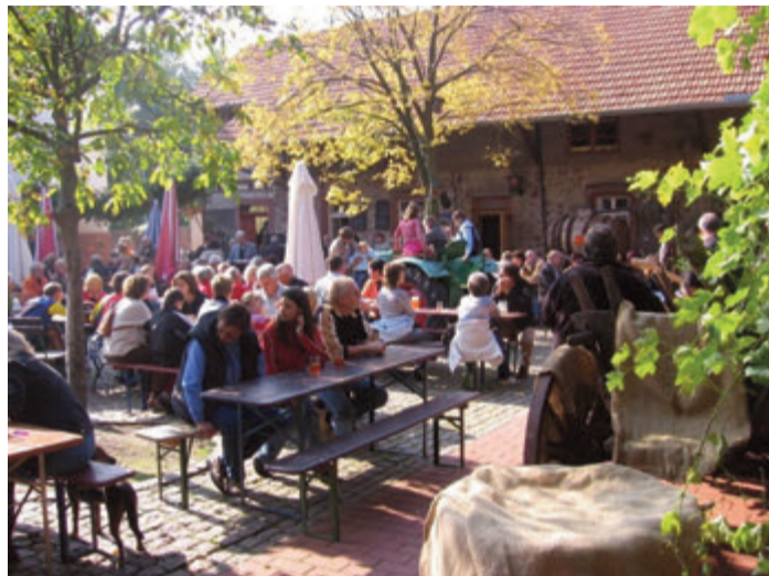
Urig und gemütlich sitzen im Gruberhof.