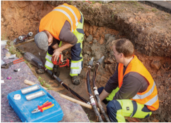
Unterirdische Arbeiten am Stromnetz.