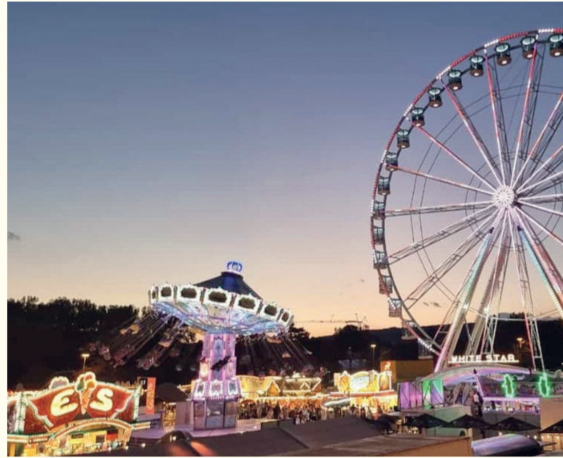
Der Bienenmarkt bei Nacht.

Michelstadt. Es ist wieder soweit: In der Pfingstwoche ist Michelstädter Bienenmarkt. Bis zum 4. Juni wird ein buntes Programm auf dem Festplatz und in der Innenstadt geboten. Die Großveranstaltung lockt jedes Jahr Zehntausende aus dem ganzen südhessischen und angrenzenden Gebiet an. Für junge und jung gebliebene Besucher laden moderne Fahrgeschäfte und traditionelle Karussellbetriebe zur Mitfahrt ein. Neben den Klassikern wie dem Kettenflieger und einem Riesenrad, wird es in diesem Jahr auch eine gruselige Geisterbahn und die neue Achterbahn „Time Machine“ geben. Highlight in diesem Jahr ist die Riesenrutsche, auf der bis zu sechs Personen gleichzeitig auf die Wette rutschen können. Auf dem weitläufigen und nahezu barrierefreien Marktgelände sorgen eine Vielzahl von Belustigungs- und Verkaufsgeschäften für einen schönen Aufenthalt für die ganze Familie. Ebenso kurzweilig ist das Warenangebot der rund 80 Händler, die rings um den Vergnügungspark einen Verkaufsmarkt bilden. Die Aquarienausstellung mit Zierfisch- und Pflanzenbörse im Aquarienheim auf dem Festplatz ist täglich geöffnet. In den vier großen Festzelten – jedes davon mit gemütlichem Au-