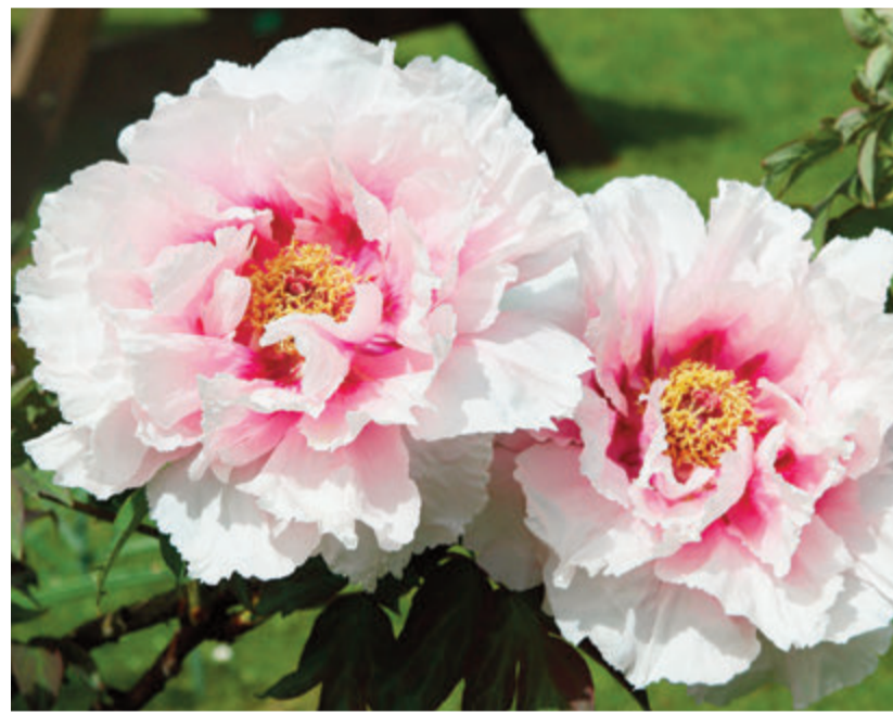
Wir wünschen allen Leserinnen und Lesern schöne Pfingstfeiertage und ein gutes langes Wochenende.

Landkreis Darmstadt-Dieburg. Direkt nach der freien Zeit, die Muttertag und Vatertag mit sich brachten, folgt eines der höchsten christlichen Feste: Pfingsten. Das Pfingstfest wird 50 Tage nach Ostern gefeiert und gilt nach Weihnachten, Ostern und Karfreitag als bedeutendstes Fest der christlichen Kirche. Der religiöse Hintergrund: Der Geist Gottes soll an diesem Tag in Gestalt einer weißen Taube den Jüngern erschienen sein. Die weiße Taube ist in der christlichen Bilderlehre oft ein Symbol für den heiligen Geist. Wer eine Kirchenkuppel hochsieht, wird dort oftmals das Bild einer weißen Taube sehen. Über die Zeit haben sich viele Bräuche und Traditionen zu Pfingsten herausgebildet. So wird Pfingsten auch als Frühlings- oder Sommerfest gefeiert, es gibt Flurumritte und Prozessionen. Auch das Aufstellen eines geschmückten Baumes oder Schmuck an einem Brunnen sind üblich. Früher wurden die Tiere an Pfingsten zum ersten Mal auf die Weiden geführt – oft führte ein geschmückter Ochse die Prozession an: Der sogenannte Pfingstochse. Für den Pfingstmontag, 29. Mai, lädt der Pastoralraum „Otzberger Land“ zu einem zentralen Pfingstgottesdienst nach Groß-Umstadt in das Pfarrzentrum St. Wenzel, Eisenacher Str. 7, ein. Beginn ist 10.30 Uhr. Zu dem Pastoralraum gehören die katholischen Pfarrgemeinden in Fischbachtal, Groß-