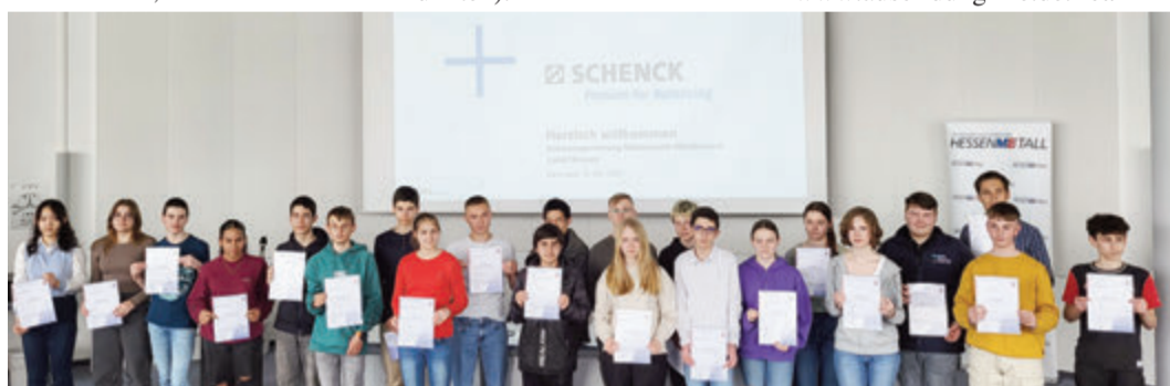
Ehrung der südhessischen Sieger bei der Carl Schenck AG in Darmstadt.

Freie Ausbildungsplätze, Informationen über Berufe, Bewerbungstipps finden Schülerinnen und Schüler sowie Eltern auf www.ausbildung-me.de . red