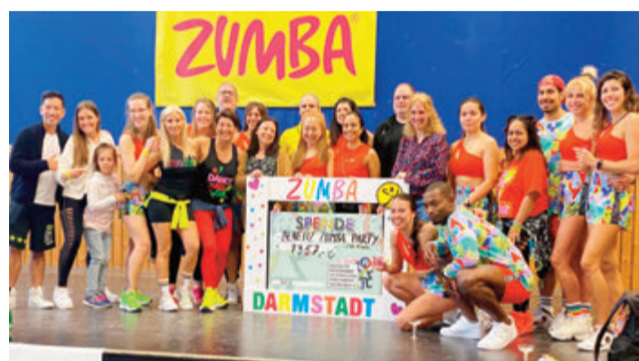
Eine von ZUMBA begeisterte Fangemeinde freute sich bei der Spendenübergabe sehr über den Erfolg.