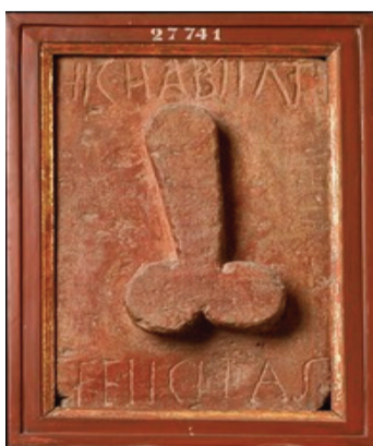
Hic habitat felicitas – hier wohnt das Glück! Das Relief aus Pompeji dürfte auf einen Bordellbetrieb hingewiesen haben.

Höchst. Der Haselburgverein lädt am Sonntag, 11. Juni um 16 Uhr zum Vortrag „Sexualität und Erotik in der antiken Welt“ im Haselburg-Informationszentrum ein. Der Eintritt kostet drei Euro, Getränke und Snacks werden gereicht.