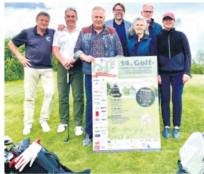
Am 8. Juni wird wieder für den guten Zweck Golf gespielt.

Rodgau (RZ) Den 8.Juni sollten sich alle Rodgauer Golf-Sportler:innen in ihrem Terminkalender vormerken.