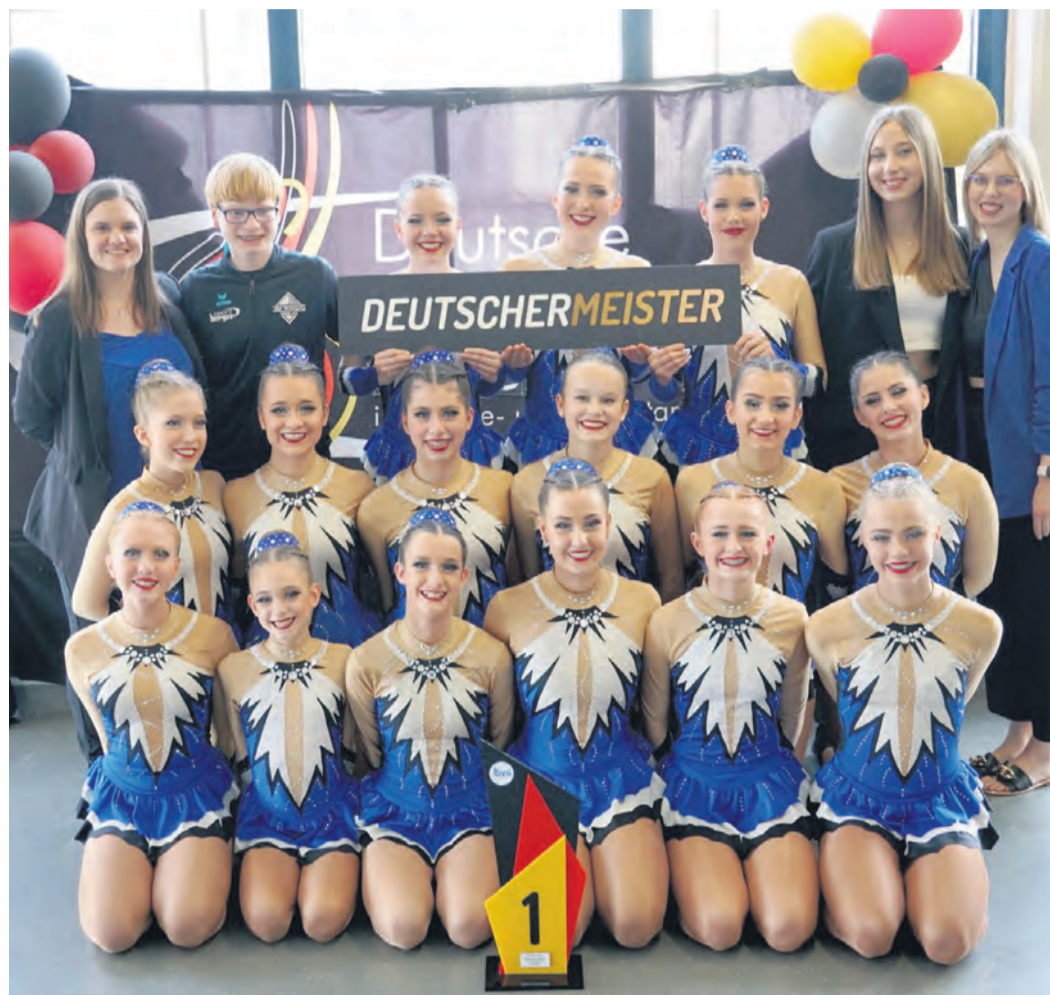
Die erfolgreichen Tinyloose.

Den Anfang machten am Samstagvormittag die jüngsten