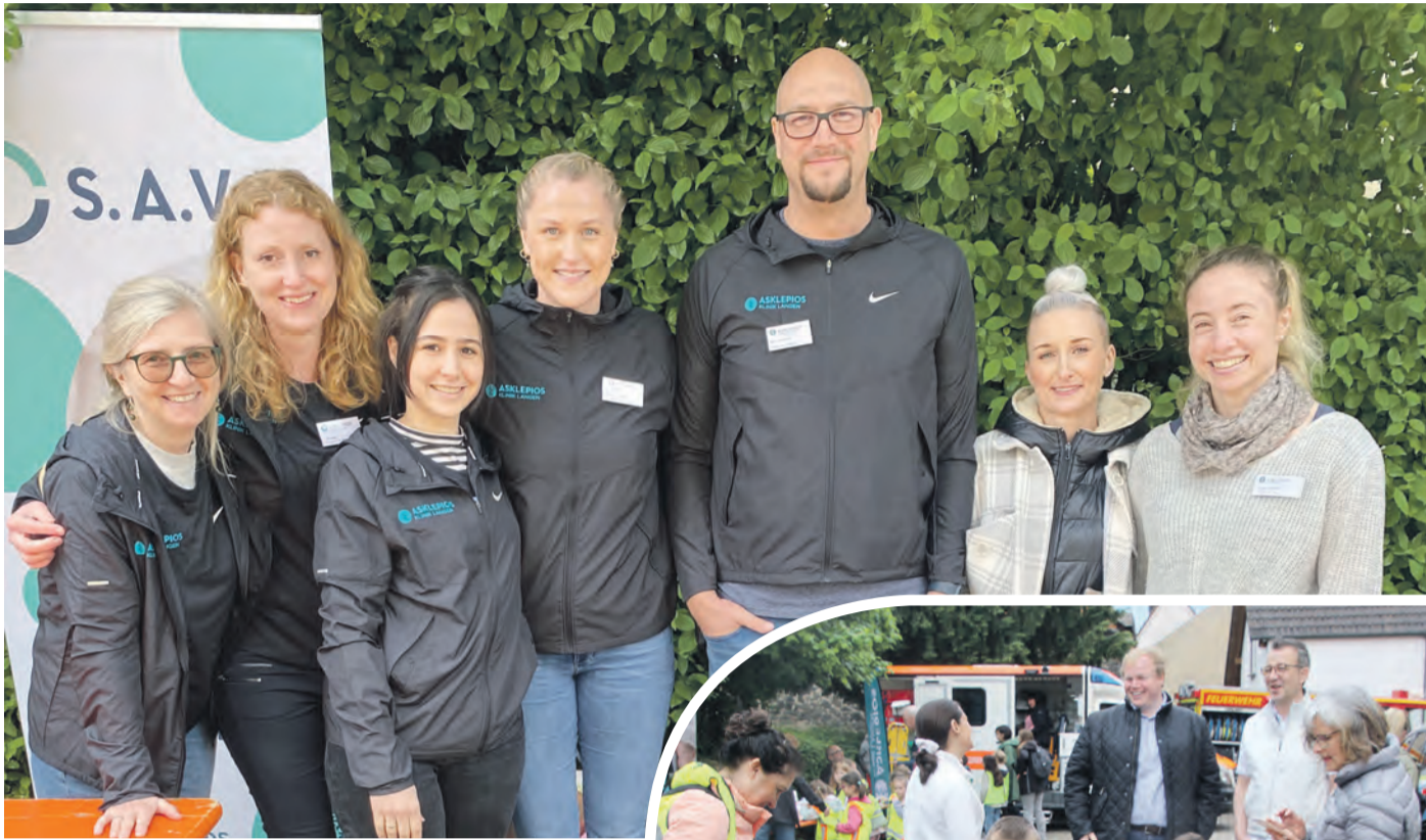
Die beiden Teams der Asklepios Kliniken Langen und Seligenstadt begeisterten die Kinder und erhielten viel Lob und Zuspruch.