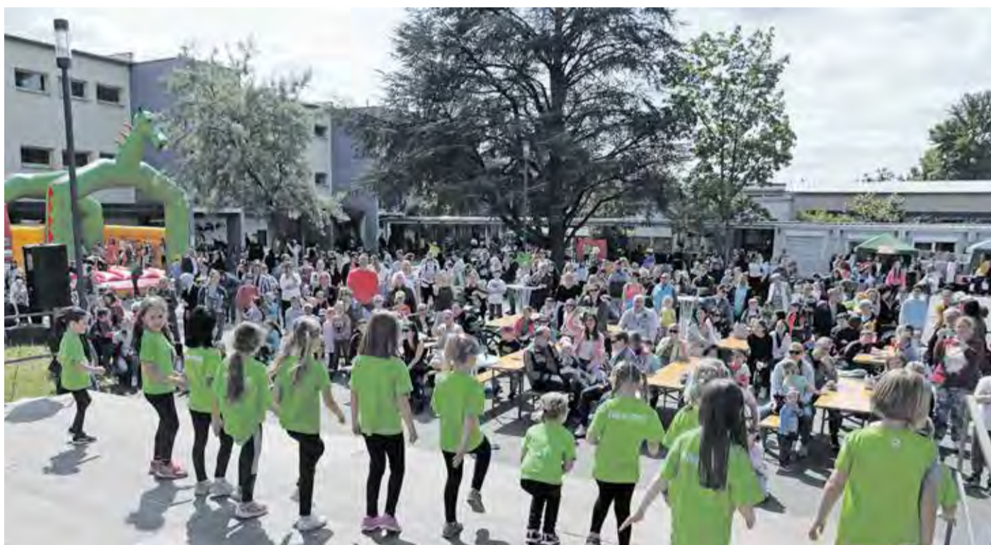
Die Kindertanzgruppe des Turnvereins Erfelden hatte ein großes Publikum beim Kinderfest