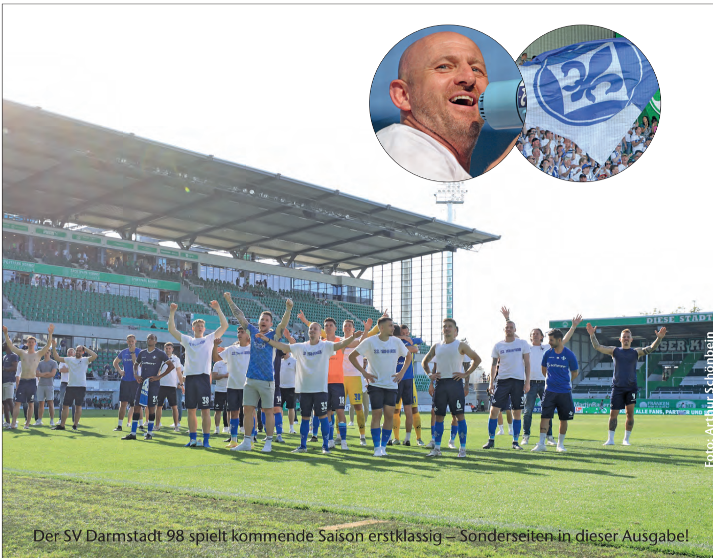
Der SV Darmstadt 98 spielt kommende Saison erstklassig – Sonderseiten in dieser Ausgabe!