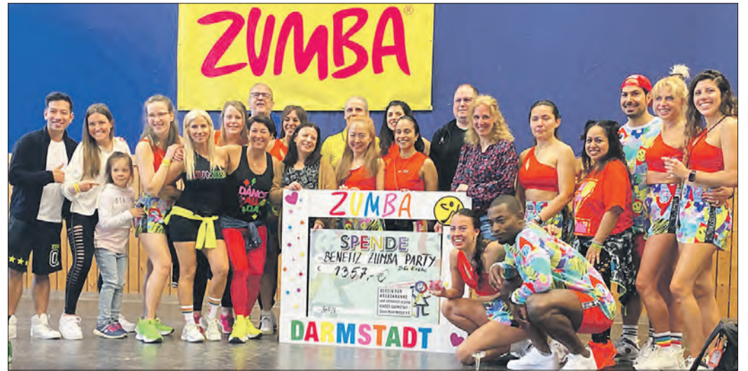
EINE VON ZUMBA BEGEISTERTE FANGEMEINDE freute sich bei der Spendenübergabe sehr über den Erfolg.

1.357 Euro an VKKD - Verein für krebskranke und chronisch kranke Kinder