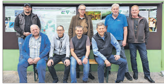
Bürgermeister Geza Krebs-Wetzel (3.v.r.) mit dem Vorstand des Griesheimer Angelsportvereins sowie den Vertretern des NABU und des Hessischen Fischerverbands.

„Neben dem wichtigen Klimaschutz müssen wir uns als Gesellschaft auch deutlich für den Erhalt der biologischen Vielfalt und den Artenschutz in den natürlichen Lebensräumen, wie dem Naturschutzgebiet ‚Griesheimer